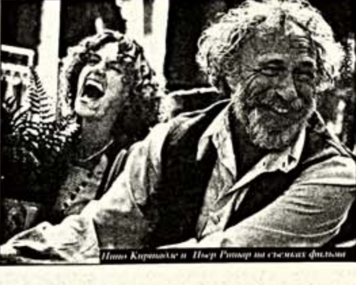
Пьер Ришар и другие на съемках фильма

наших залов (в санатории мы идем с концертами сами). Против нас сегодня работает и политическая обстановка — Чечня, Буденновск. Но объем своей филармонической деятельности мы есля и сократили, то не на много. А вот гастрольную деятельность оократили очень сильно. Одного артиста привезти-увести из Москвы — уже похмельная, а в оркестре их сотни, прибавьте гостиницу, гонорар... Раньше на кисловодском пятке можно было встретить весь московский и петербургский бонд. Сюда просто надо было приехать, потому что это был лучший музыкальный центр страны, всеобщая, потом всеобщая сцена. Теперь предпочитают ездить за рублем. Меня как-то спросили, что надо сделать, чтобы концертное дело на Кавминводах пошло вверх, в ответ: "Реанимировать курортное местное население слишком большой монстр. Появится публика — я в два счета сделаю гастрольный билет, потому что если будет не 50, а 500 тысяч потенциальных зрителей, то выйдет средн их тысяч, которая сможет купить дорогой билет. Сегодня же продать билет дороже 25 тысяч на Кавминводах невозможно (значит, невозможно продавать концертному гастролеру в достойный гонорар — Л.Д.). И все-таки мы попытаемся не