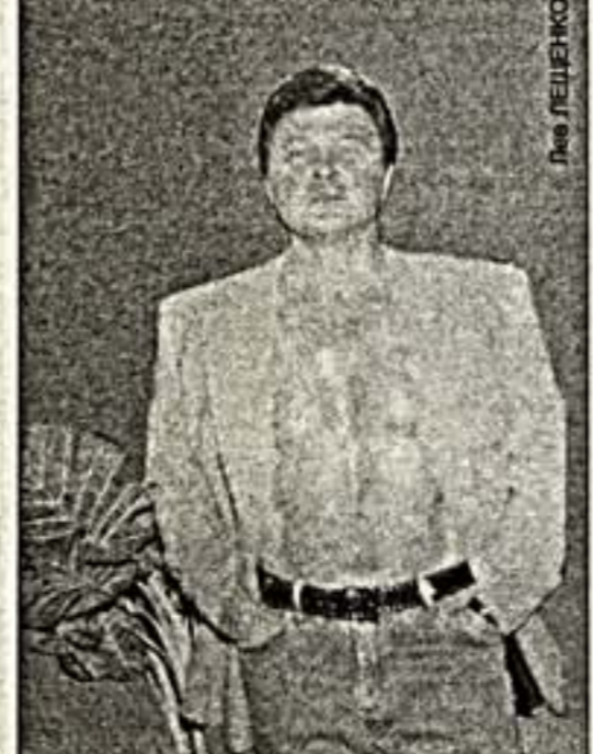
Ибо я изнемогаю от любви.