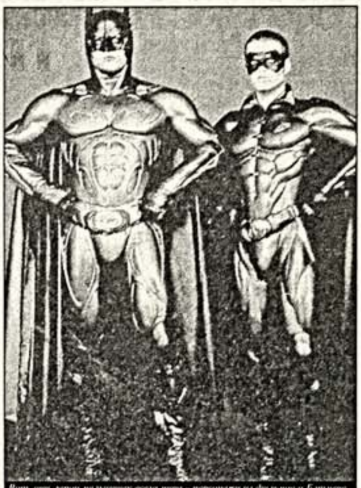
Вот так, герой летучих мышей — персонаж из фильма "Бэтмен"

На роль Бэтмена был приглашен актер Вал Килмер. По убеждению режиссера, "в нем есть что-то действительно дикое, животное", чего, наверно, не хватало Китону. На подготовку к съемке ушел год. За это время было создано 98 различных декораций (для "Бэтмена" № 2 их потребовалось всего семь). Сам же Килмер в течение 100 дней и обобщил "Уорнер Бразерс" в 80 миллионов долларов. Почти столько же пришлось выложить и за "промоушн", мы бы сказали, за раскрутку — неотъемлемое условие кассового успеха фильма. Задолго до премьеры в Америке появились афиши с традиционной эмблемой "Бэтмена", затем "постеры" с индивидуальными изображениями всех героев фильма — и плохих, и хороших. "Постеры" явно понравились публике, об этом красноречиво свидетельствует то, что 20 процентов из них были тут же сорваны с рекламных щитов. И наконец в день открытия летнего киносеzona была представлена уже официальная афиша нового "Бэтмена". Все эти старания оказались напрасными, и после первых двух дней проката компания "Уорнер Бразерс" смогла вздохнуть с облегчением: только за это время "Бэтмен" собрал 53 миллиона долларов.