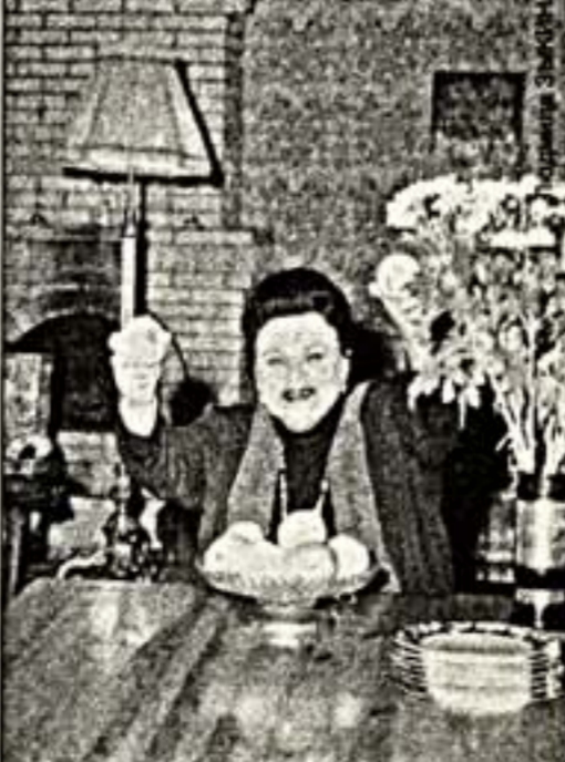
Накормите меня яблоками...