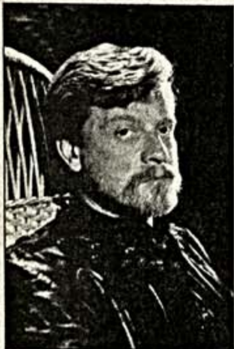
ИЗ ПЕРВЫХ РУК