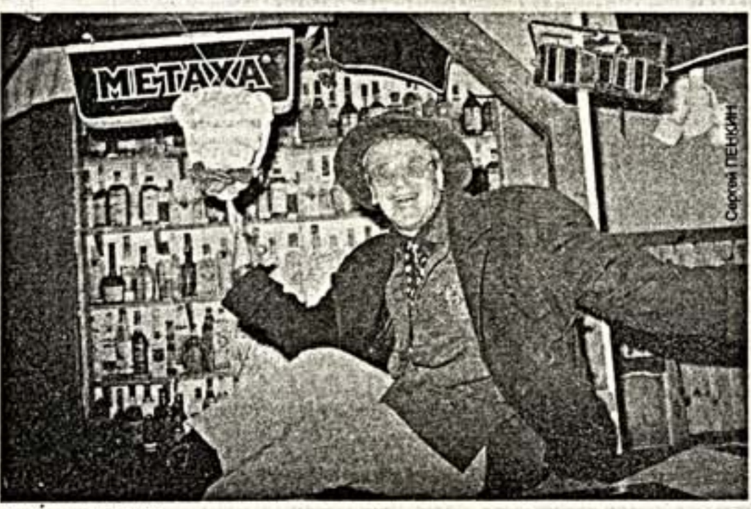
Напоите меня вином...