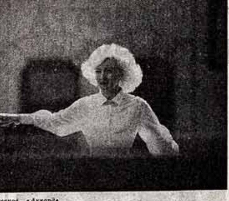
Л. Асанов. «Акорде».