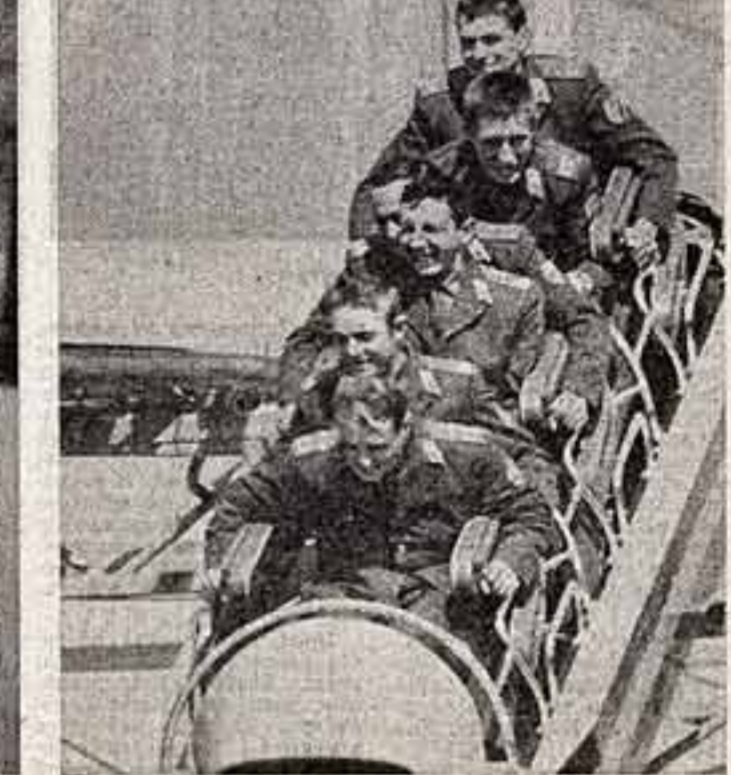
В. Пассекин. «Экспонат из отделе».