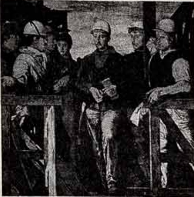
Вернер Тюбке. «Групповой портрет».

Радуго выпрямили, разре- зали на кусочки и составили из них римскую цифру VII. На знаменитой Брюльской террасе в Дрездене над туго натянутым ледяным полотном Эльбы выстроились прино- сильницы — взгляд плакаты: «VII выставка изобразитель- ного искусства ГДР». С от- крытия прошлого по конец марта этого года музей «Аль- бертинума» показывает около двух тысяч работ живопис- цев, графиков, скульпторов, мастеров прикладного искус- ства республики.