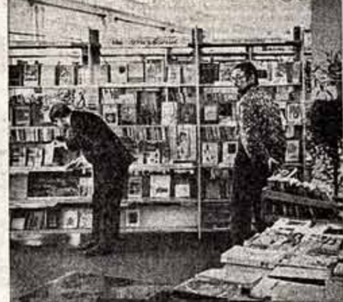
С утра заплохаются просторные залы трехэтажного Дома культуры. Свободный доступ к книжкам, выставкам, стодам своей литературы обеспечил заводскую библиотеку любимой читальней тысяч горожан.