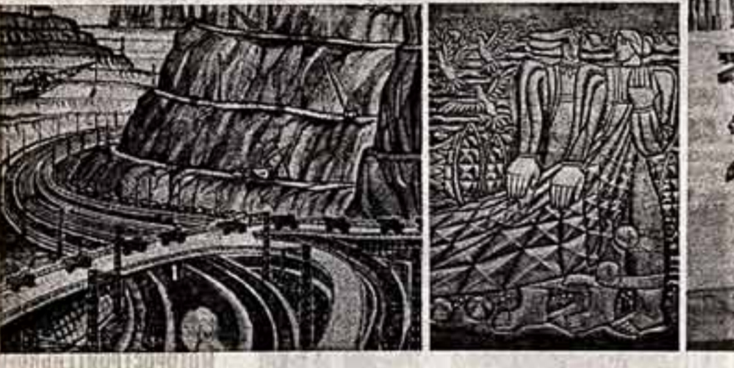
Тодор Павлов работы Е. Вучетича, граверу М. Азурова из серии «Курская магнитная аномалия»