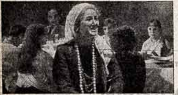
На сцене: сцена из спектакля.

Б. СМЕРНОВ, народный артист СССР, лауреат Ленинской премии.