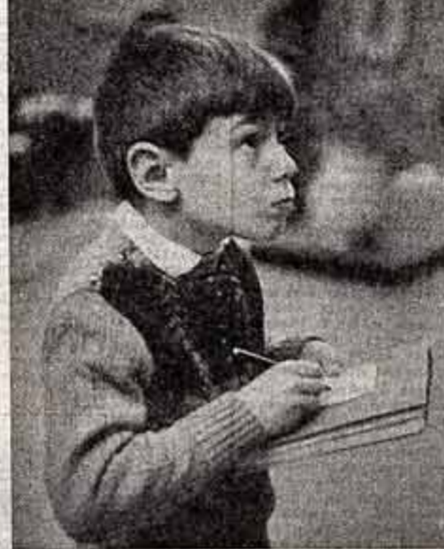
М. Корнев. «В музее».