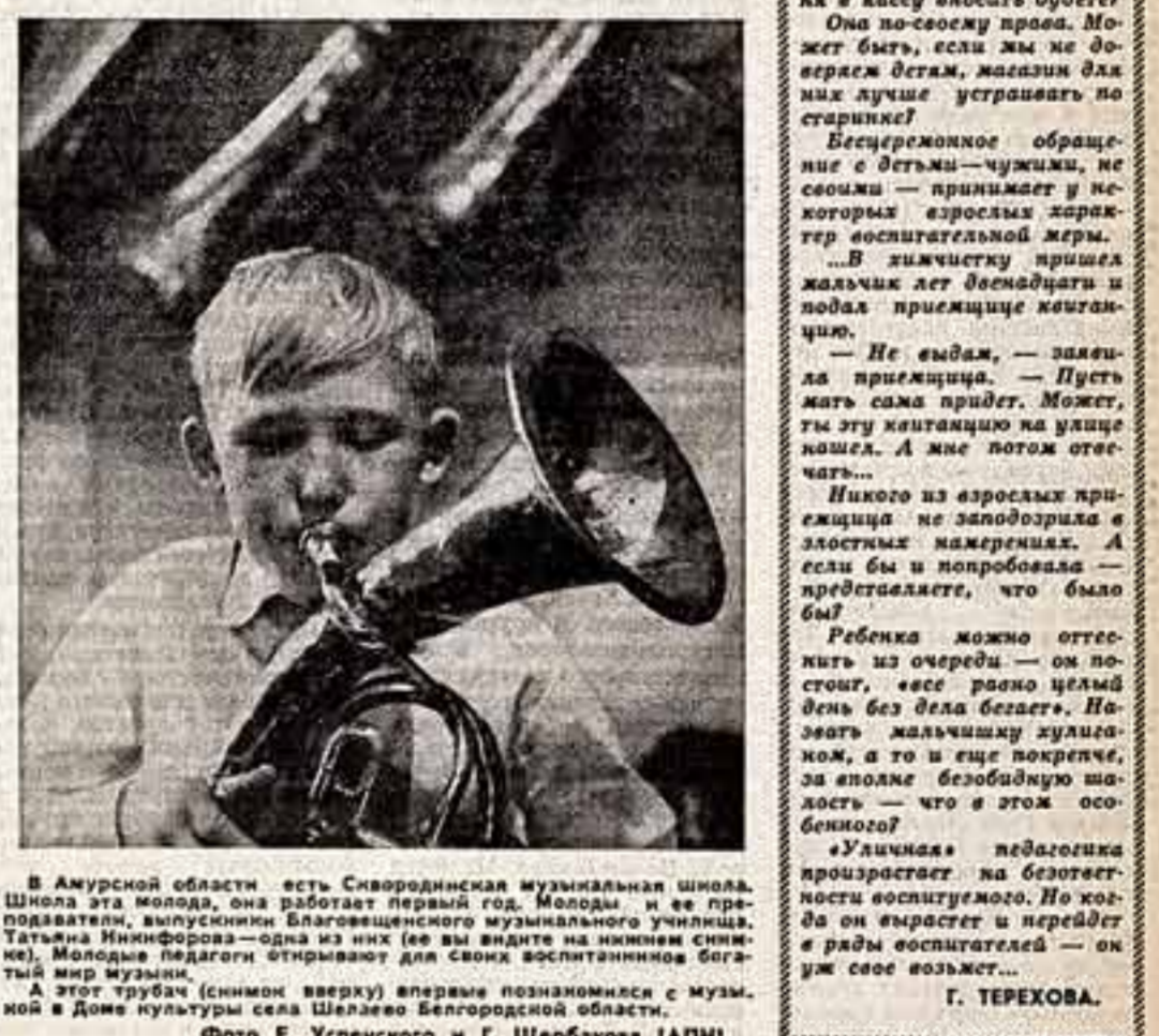
В Амурской области есть Свердловская музыкальная школа. Школа эта молодая, она работает первый год. Молоды и ее преподаватели, выпускники Благовещенского музыкального училища.

Вот его первый спектакль. Никому из публики не приходило в голову, что словесная партия Гремиза изучена