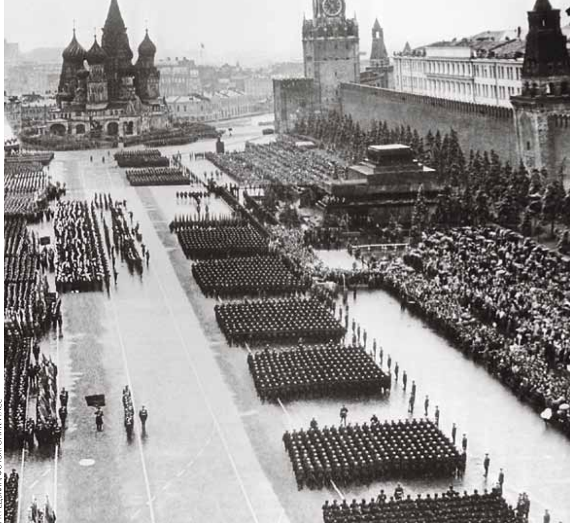
Москва. Красная площадь. 24 июня 1945 года

1 Малышев: Преподавали нам, кстати говоря, и тактику танкового боя, что могло показаться излишеством — где-то грела война, хотелось скорее на передовую. Но зато, почти полтора года проведя в классах и на полигонах, мы, лейтенанты выпуска начала 44-го, уже не были скороспелыми командирами первого военного года. Многие знали и умели, нас научили «видеть поле боя». На фронте это мне очень помогло.