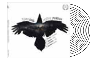
Alban Berg / Olivier Messiaen Мелодия

Австрийца Альбана Берга и француза Оливье Мессиана объединяет новаторский подход к музыке, стремление отойти от устоявшихся традиций и канонов. Так, ученик Шенберга Берг на протяжении всей жизни исповедовал атональный стиль. В нем написаны «Четыре пьесы для кларнета и фортепиано» — данное сочинение явилось своеобразным трамплином к созданию главного шедевра Берга, оперы «Воцек». Что касается Мессиана, то его творчество и вовсе представляет собой самостоятельную, независимую от каких-либо школ и направлений область современной музыки. «Квартет на конец времени», написанный в 1941-м, — квинтэссенция авангардного мышления французского композитора и одна из самых удивительных страниц камерной музыки XX столетия. Произведения Альбана Берга и Оливье Мессиана впервые были исполнены в СССР в 1988-м на музыкальном фестивале «Дар лозе», проходившем в Телави. Запись «Квартета на конец времени» датируется декабрем того же года — тогда в ГМИИ им. А.С. Пушкина проводился фестиваль «Декабрьские вечера». Фонограмма ценна еще и тем, что зафиксировала одно из последних московских выступлений замечательного скрипача Олега Кагана.