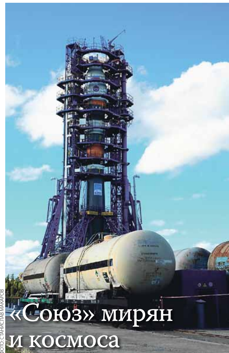
«Союз» мирян и космоса

Здесь, на Красной площади, считай, война для меня и закончилась. Хотелось еще Родине послужить, но на Дальнем Востоке масштаб боевых действий был значительно меньший, а нас, офицеров-танкистов, оказалось слишком много. Началась демобилизация, и я вернулся домой, в Аламу-Ату.