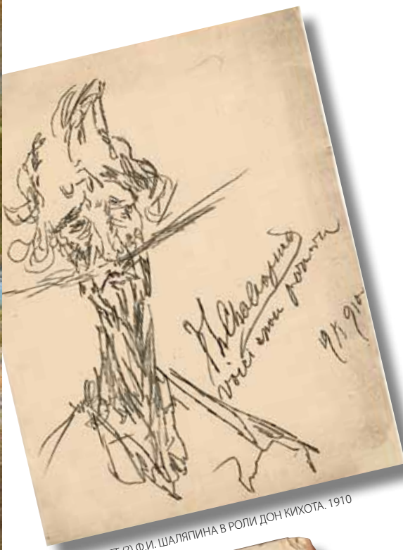
АВТОПОРТРЕТ (П. И. ШАЛЯПИНА В РОЛИ ДОН КИХОТА. 1910)