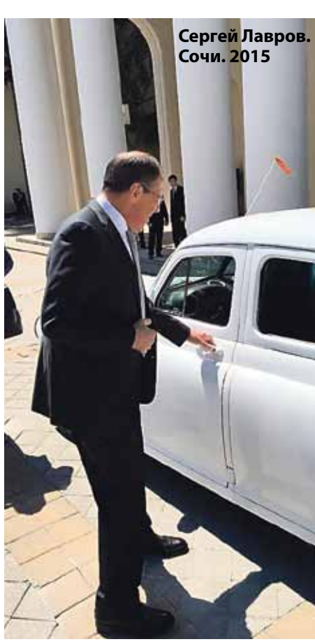
Сергей Лавров. Сочи. 2015

«Да, автомобиль можно было приобрести. Вот только в культуре советского человека, в наших традициях, он тогда еще отсутствовал. Отсюда и низкий спрос. Темпы развития автопрома свидетельствовали, что руководство страны устремлено в будущее. Но в комплексе проект не реализовали — не успели. Требовались еще сети АЗС, станций техобслуживания, придорожных кафе-ресторанов, кемпингов и мо-