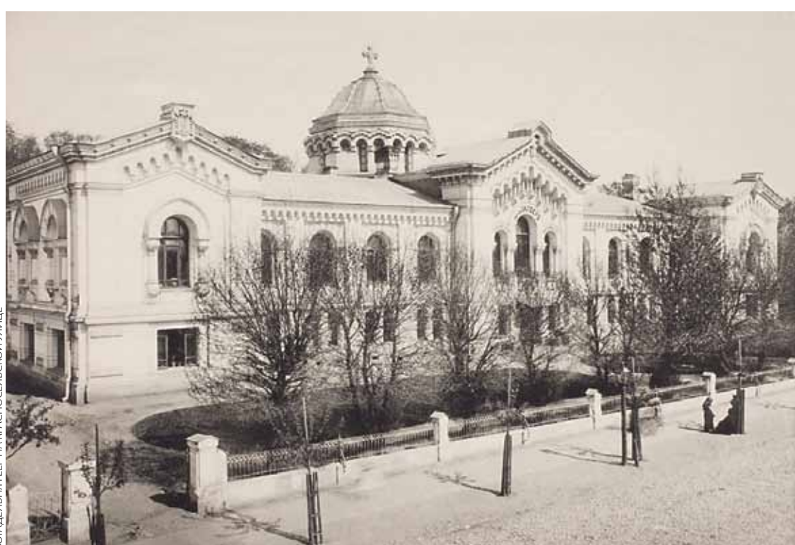
БОГАДЕЛЬНИК ГЕР НА КАРСКОСЕЛЬСКОЙ УЛИЦЕ