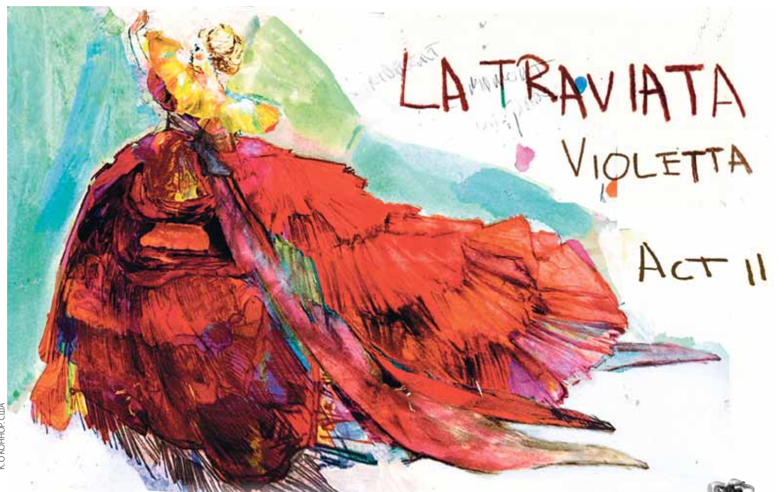
К. ЮКОНОК. СЛА