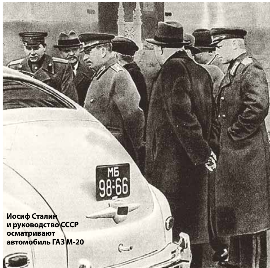
Иосиф Сталин и руководство СССР осматривают автомобиль ГАЗ М-20