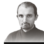
Автор — публицист

США давно уже не могут существовать просто как большая и сильная страна со своими национальными интересами. Модель «мира по-американски» уже давно не является просто формой существования американского государства. США сами стали, по сути, заложником в деле продвижения проекта глобализации: плана мирового господства, осуществляемого англо-саксонскими элитами. Отказаться от его осуществления они, даже если бы и захотели, уже не могут — игра зашла так далеко, что выйти из нее без огромных потерь для уровня жизни обычного американца и без болезненного удара по самолюбию элит невозможно. Точнее, для этого нужна практически революция — если не на планетах, то хотя бы в сознании американцев. Подобных перспектив не просматривается, а значит, отказ от глобального проекта произойдет только после того, как он начнет сыпаться по всем направлениям, и элита попытается спасти хотя бы сами Соединенные Штаты.