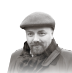
Автор — публицист

Как ограться себя, не прибегая к дискриминации по этническому признаку? Только одним путем: проявляя такую дискриминацию там, где она уместна, допустима и совершенно законна, — при пересечении государственной границы. Визовые и иные ограничения — единственный способ сделать так, чтобы новые человеческие потоки не развивали наши общественные отношения и не вели к внедрению всевозможной дикости как чего-то само собой разумеющегося.