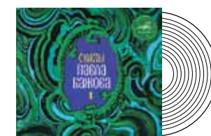
«Сказы Павла Бажова» Мелодия

Австрийца Альбана Берга и француза Оливье Мессиана объединяет новаторский подход к музыке, стремление отойти от устоявшихся традиций и канонов. Так, ученик Шенберга Берг на протяжении всей жизни исповедовал атональный стиль. В нем написаны «Четыре пьесы для кларнета и фортепиано» — данное сочинение явилось своеобразным трамплином к созданию главного шедевра Берга, оперы «Воцек». Что касается Мессиана, то его творчество и вовсе представляет собой самостоятельную, независимую от каких-либо школ и направлений область современной музыки. «Квартет на конец времени», написанный в 1941-м, — квинтэссенция авангардного мышления французского композитора и одна из самых удивительных страниц камерной музыки XX столетия. Произведения Альбана Берга и Оливье Мессиана впервые были исполнены в СССР в 1988-м на музыкальном фестивале «Дар лозе», проходившем в Телави. Запись «Квартета на конец времени» датируется декабрем того же года — тогда в ГМИИ им. А.С. Пушкина проводился фестиваль «Декабрьские вечера». Фонограмма ценна еще и тем, что зафиксировала одно из последних московских выступлений замечательного скрипача Олега Кагана.