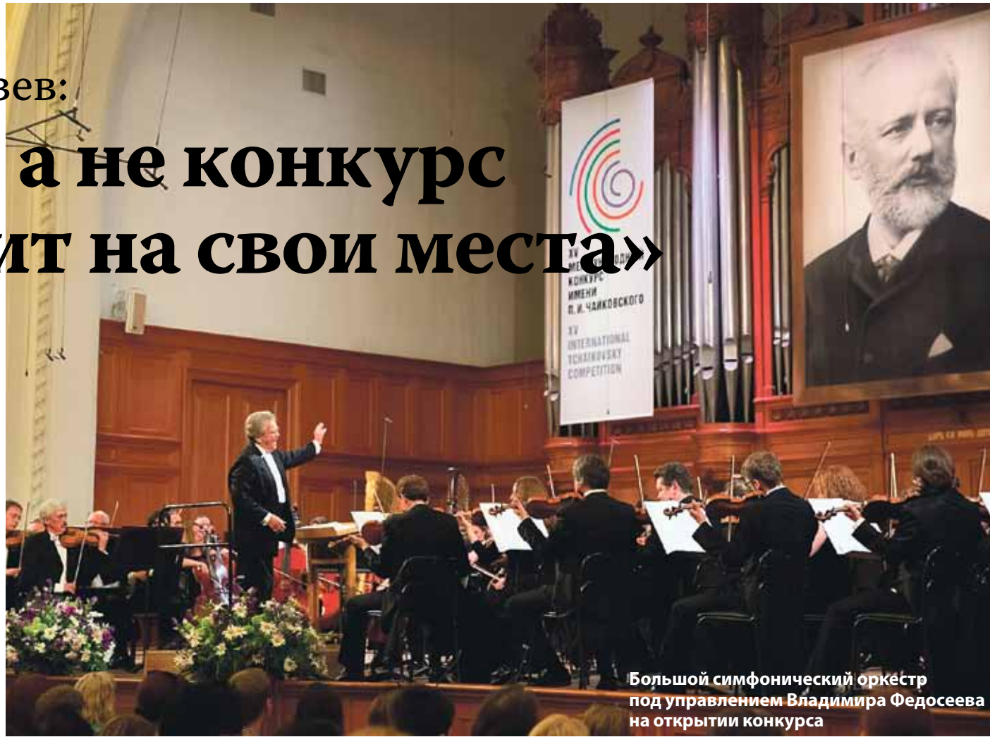
Большой симфонический оркестр под управлением Владимира Федосеева на открытии конкурса

культура: Конкурс разделили. В Москве — фортепиано и скрипка. В Петербурге — виолончель и сольное пение. Нет ли в этом дискриминации?