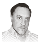
Автор — публицист

Огромное внимание в клубе уделялось Советскому Союзу. Так, нынешний председатель клуба Дэвид Рокфеллер встречался с Хрущевым и Косыгиным, трижды — с Горбачевым. Кстати, и сам приход Горбачева к власти, и его шаги на посту главы государства — не результат ли умелой политики мирового правительства? Ну а чем, как не операции «Внедрение», может быть названо создание в начале девяностых так называемого Российско-американского банковского форума — группы советников, направленных главой Федерального резервного банка Нью-Йорка с одобрения Бориса Ельцина для модернизации банковской системы России? Возглавлял группу все тот же Дэвид Рокфеллер, отмечавший, кстати, 12 июня свой столетний юбилей. Именно ему принадлежат многие объясняющие слова, сказанные еще в 1991-м: «Мы благодарны «Вашингтон пост», «Нью-Йорк таймс», журналу «Тайм» и другим выдающимся изда-