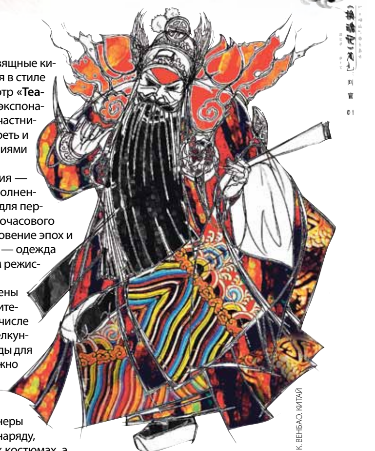
К. ВЕНЕАО. МТМ

В целом в моде эклектика и постмодернистские цитаты: скажем, дизайнеры запросто могут приделать гофрированный воротник к современному наряду, состоящему из шорт и тогика. Насколько уютно актерам в подобных костюмах, а также как это сочетается с оригинальной пьесой или либретто, — уже другой вопрос.