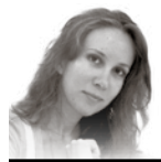
Автор — обозреватель «Культуры»

Хочется верить, что нет. Ведь желание получать эстетическое удовольствие неистребимо. Ни один фотоаппарат не сможет заменить воображаемые миры, рожденные в голове художника и перенесенные на холст. Как ни одна инсталляция — любой из портретов Серебряковой, всегда что-то рассказывающий о жизни и бессмертии. Без ловких манипуляций вроде пространных подписей в каталогах.