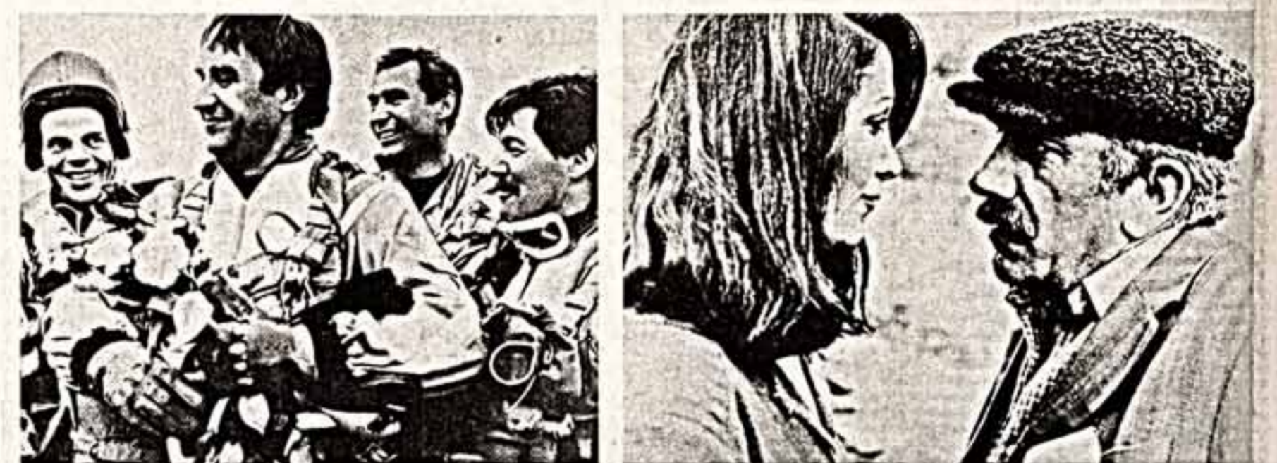
Кадры из фильмов «Свободное падение» и «Одинокая орешника»