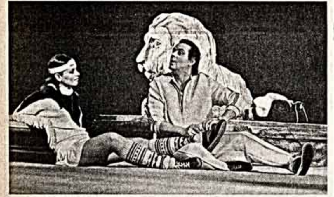
С большим успехом на сцене Казанского Большого драматического театра имени В. И. Кавалова идет комедия-гротеск Э. Рабле «Спортивные сексы 1981 года».

Два вечера после концерта Большого театра СССР была представлена нашему американскому гостю солисту Метрополитен-Опера Полу Паличчи.