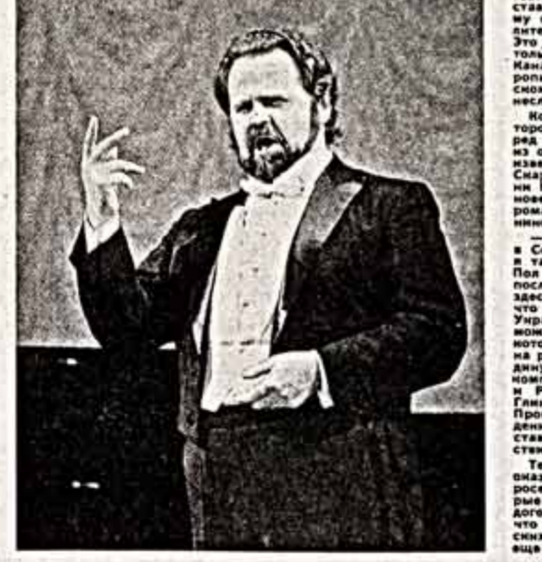
Сцена из спектакля.