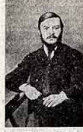
И. М. СЕЧЕНОВ

«Именно в этот период жизни Сеченова был сформирован его научный стиль...»