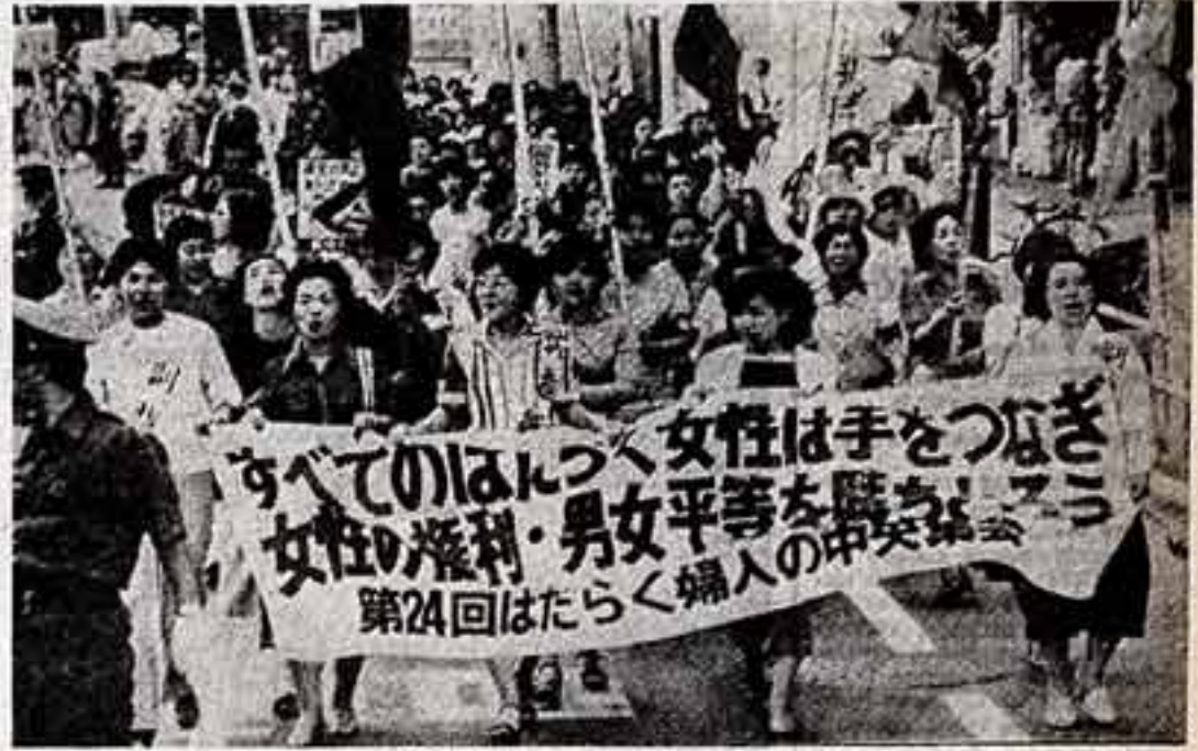
Женщины в Японии по-прежнему считаются «людьми второго сорта». Социальное неравенство, проявляющееся практически во всех сферах жизни, вызывает у жительниц Японских островов злословный протест. Недавно по улицам Токио прошла многотысячная демонстрация японских женщин, требующих осуществления своих гражданских прав.