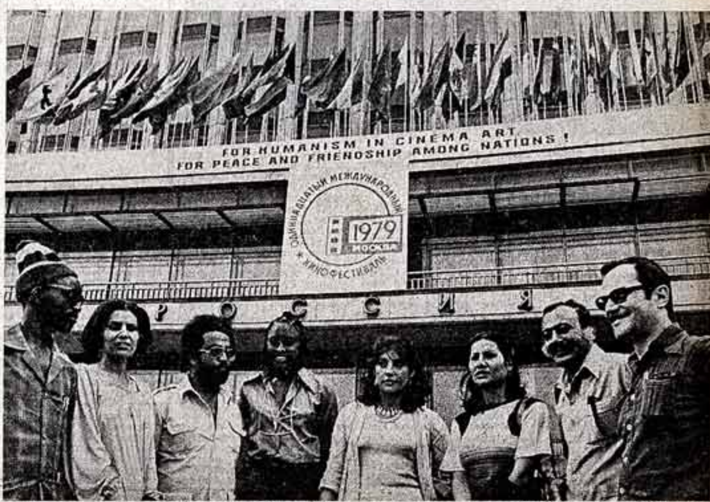
Они приехали в Москву на кинофестиваль.

Широкая участие зрителей — характерная черта нашего фестиваля. Она лишней раз свидетельствует о преданной любви советских людей к искусству экрана, которая воспитана всей славной шестидесятилетней историей советского кино.