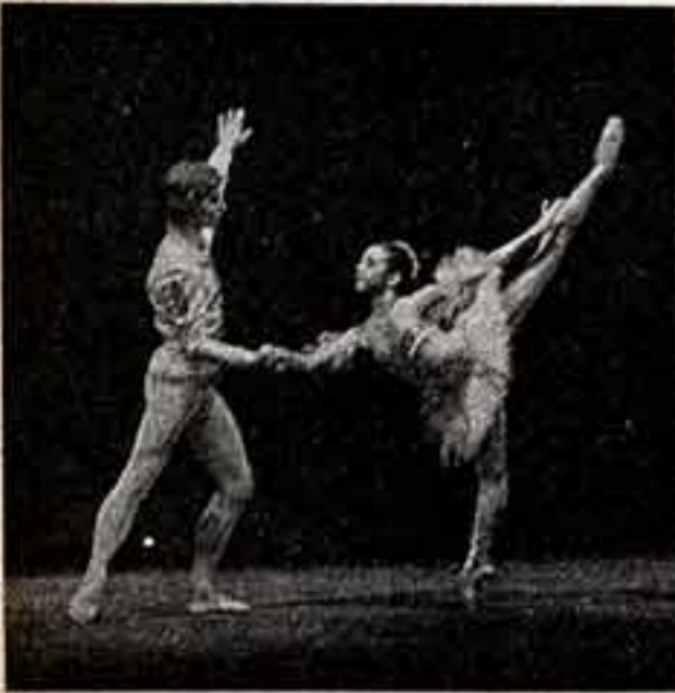
ПЕРМСКАЯ ШКОЛА БАЛЕТА

Вот уже более тридцати лет подряд в конце учебного года Пермское хореографическое училище выносит свой последний урок на профессиональную сцену Академического театра оперы и балета имени П. И. Чайковского. Ныне здесь вновь состоялся традиционный отчетный концерт выпускников училища.