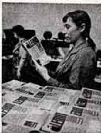
Огромный интерес трудящихся Венгрии к бескомпромиссному идею вождя мирового пролетариата. Издательство политической литературы «Косхут» выпустило в Венгрии сборник статей...