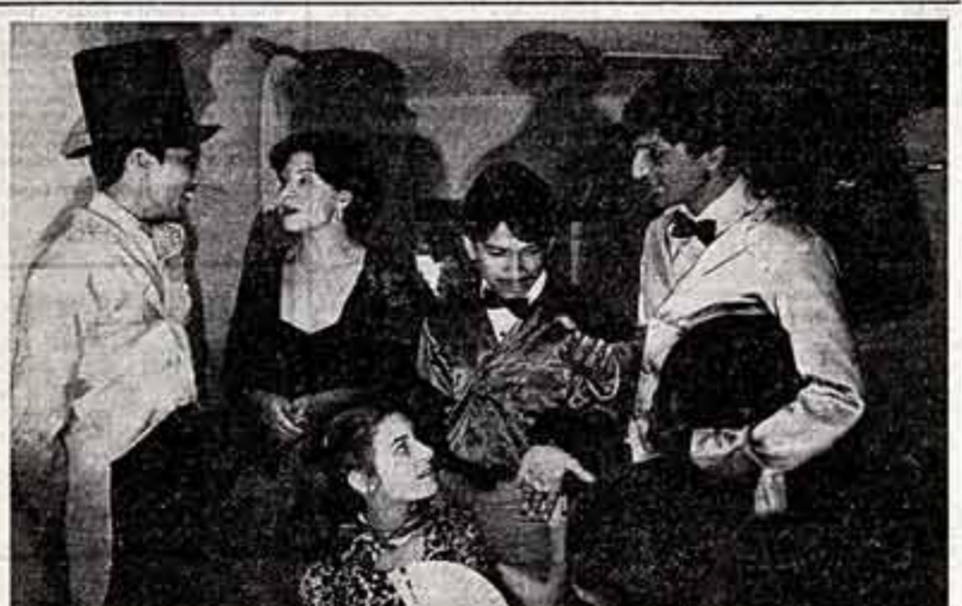
Идолы и поклонники.