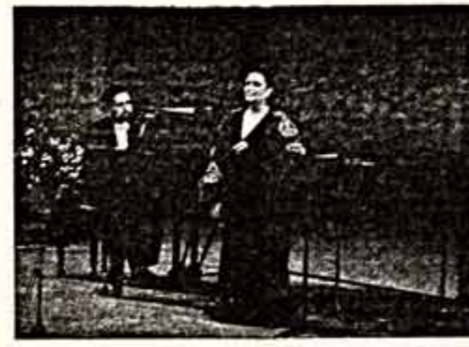
Концерт в Большой театре.