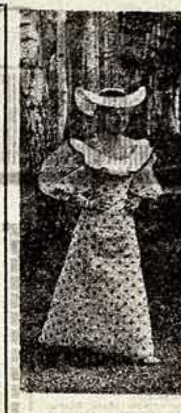
Автор сценария Л. Малкогия, режиссер С. Юткевич

Сам директор в конце смены становится у проходной и направляет всех в клуб. В результате, во всеобщую «ликовацию», за полтора месяца был «создан» хор, в котором участвовали 200 человек.