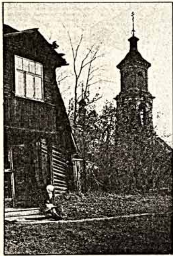
Дорога к храму.