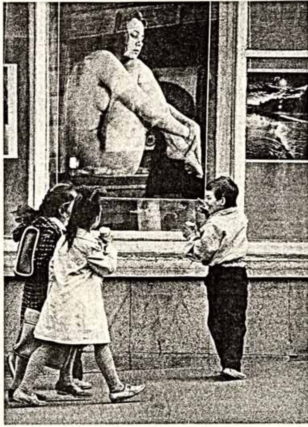
Женщина в окне.