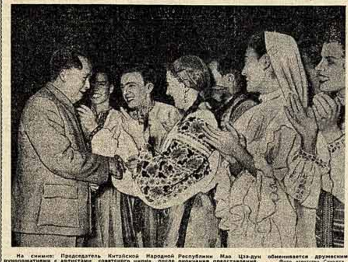
На снимке: Председатель Китайской Народной Республики Мао Цзедун обменивается дружелюбными рукопожатиями с артистами советского цирка после окончания представления.

№ 151 (543) Суббота, 22 декабря 1956 года Цена 40 коп.