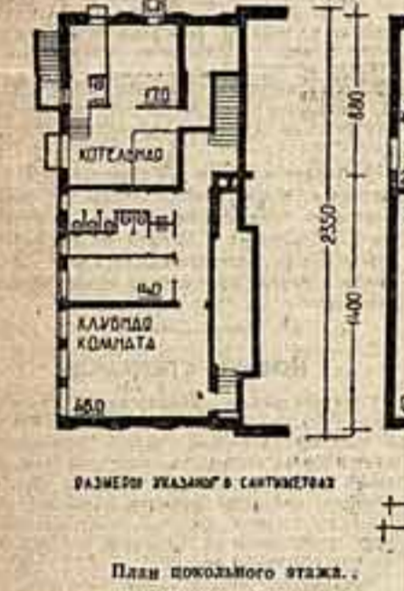
План цокольного этажа.

Рекомендации по вопросам выбора участка, более подробные сведения по отделке клуба и о специальной литературе для клубного строителя были приведены при публикации проекта типового сельского клуба со зрительным залом на 200 мест («Советская культура» № 84, от 7 июля с. г.).