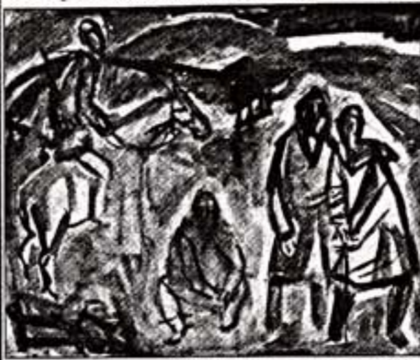
П.Никонов. "Гелоси", эскиз. 1960 г. Бумага, акварель. 40x49 см

Произведения Павла Никонова, Александра Бурганова, Игоря Обросова, Виктора Попкова, Петра Оссовского, Дмитрия и Нины Жилинских в Московском государственном музее "Дом Бурганова"