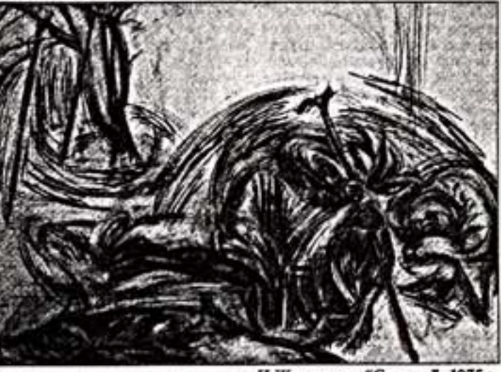
Н.Жилинская. "Slazhaya". 1975 г. Бумага, карандаш. 60,5x41,7 см

Это было время творческих поисков и спорных, время обретения личностных художественных стилей. Художники шестидесятых, как молодые боги, выстраивали свое мироощущение в искусстве с предельной искренностью и красотой, с оней эстетическим действом. Среди новых героев оказалась знаковая фигура времени — художник, воспринимавший не только литовским, но миссионером и строителем новой жизни. Художником отравлялся в поездки по стране, привозит множество натуральных зарисовок. Казалось, для того чтобы отобразить героя, необходимо прожить часть его жизни. Почти полтора года в поездах и экспедициях в Сибири Павел Никонов; освоили казахстанскую степь Александр Бурганов и Андрей Касуля; на стройках Братска работала Виктор Попков; Дмитрий Жилинский писал Москву с моточными лесовосстановителями, это ощущение огромной пилатской страны и своей причастности к ее возрождению.