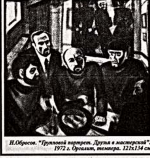
И.Обросов. "Grupovoy portret. Druzya v masterskoy". 1972 г. Органит, темпера. 121x134 см