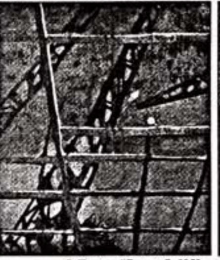
И.Обросов. "Grupovoy portret. Druzya v masterskoy". 1972 г. Органит, темпера. 121x134 см

На фоне современных художественных процессов мы все пристально вглядываемся в культурное наследие, срывая его с актуальными творческими явлениями, стремимся разделить те общие знаменья формы, которые делают искусство незаменимым и вечным. Своеобразием мостом между временами переменилась выставка "Суровый стиль", объединившая художников, чей творческий путь начался в 60-е годы. Павел Никонов, Александр Бурганов, Петр Оссовский, Виктор Попков, Игорь Обросов, Дмитрий и Нина Жилинские через много лет в своем творчестве пережили печать этого времени. Искусство "экзистенциальное" решительно декларировало новые художественные принципы и темы, остро демонстрируя разрыв со старой идеологией. Новые герои — люди, строители, рабочие — стали центральными фигурами произведений изобразительного искусства. Их образы были доведены художниками до символических значений. Возрождая бурный стиль общим лейтмотивом шестидесятников. В ставшие картины пришли монументальность и дерзость.