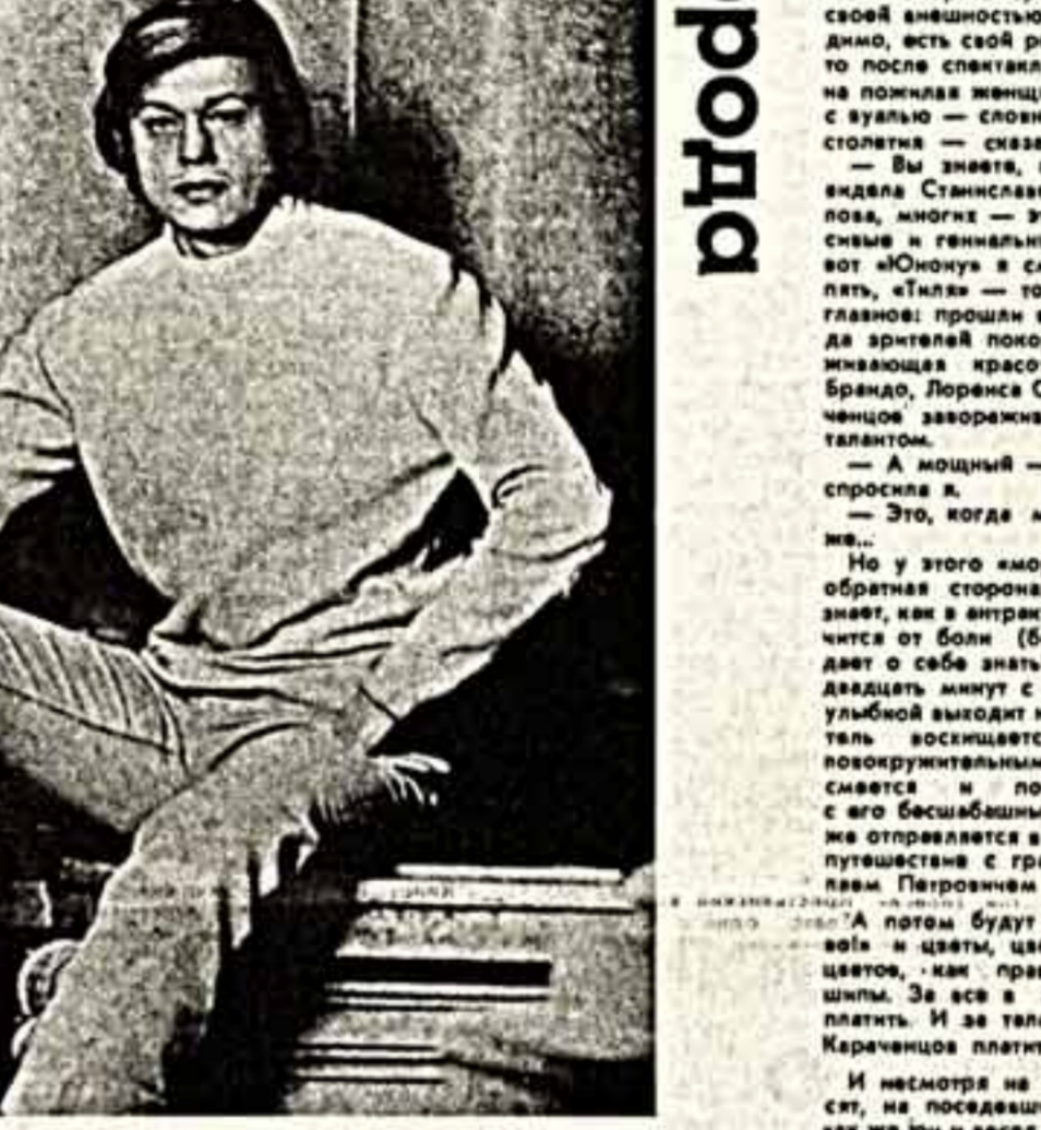
Парень из нашего города