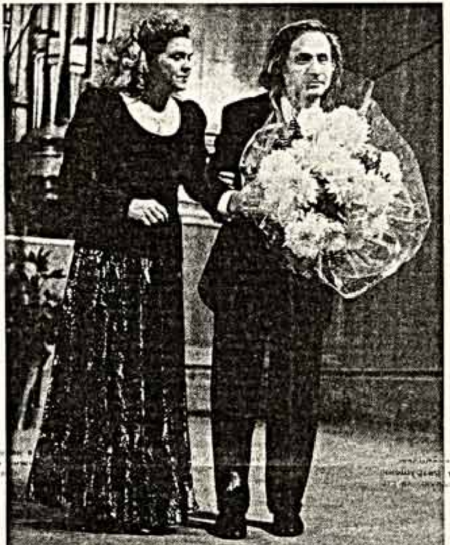
Альфреду Шнитке — 60

Время бежит, время тащит за собой хвост потерь и праздников. Веревца красных и черных дат — вот что такое календарь.