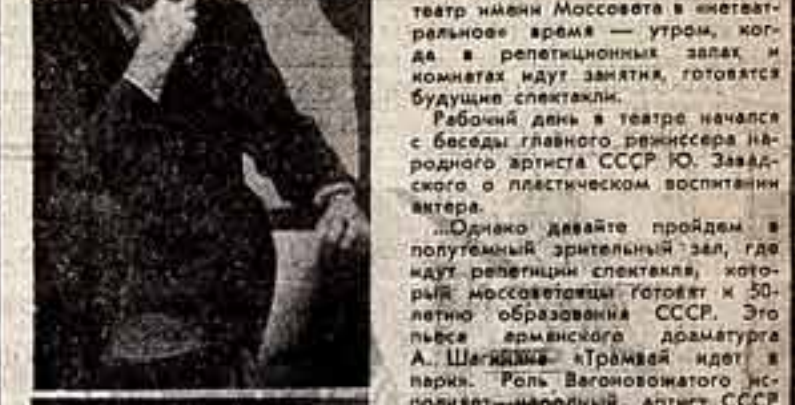
В Театре имени Моссовета