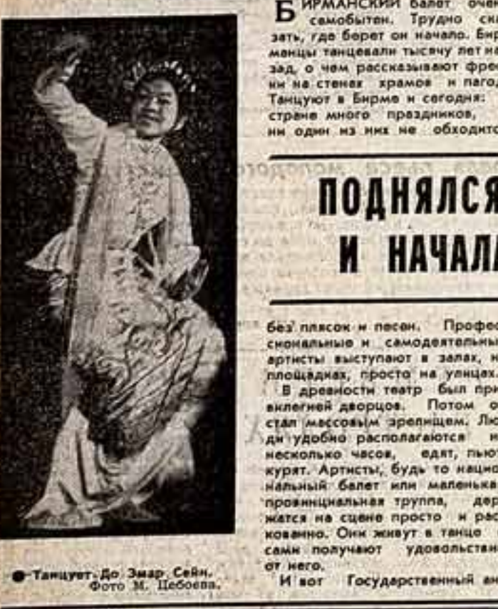
Танцует до Змар Сейн.

без плясок и песен. Профессиональные и самодеятельные артисты выступают в залах, на площадях, просто на улицах.