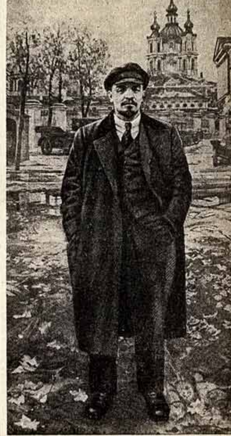
В. И. Ленин, картина художника И. Вроцкого.

НОВОЕ В ЭКСПОЗИЦИИ ЦЕНТРАЛЬНОГО МУЗЕЯ В. И. ЛЕНИНА