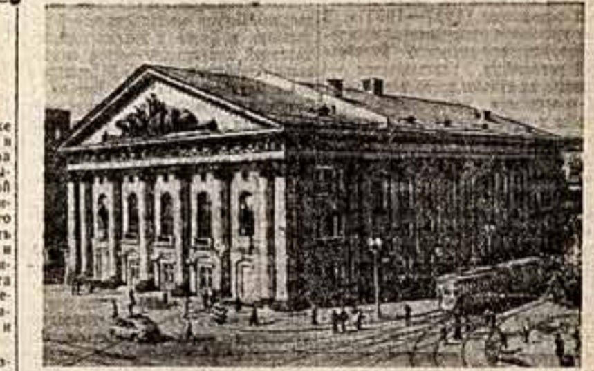
Ростов-на-Дону. (Наш корр.) В районе города, где расположены крупнейшая предприятие — комбинат «Рабочий», заводы «Ростсельмаш» и «Красный Аксай», где много институтов, техникумов, школ, открылся театр имени Ленинского комсомола.