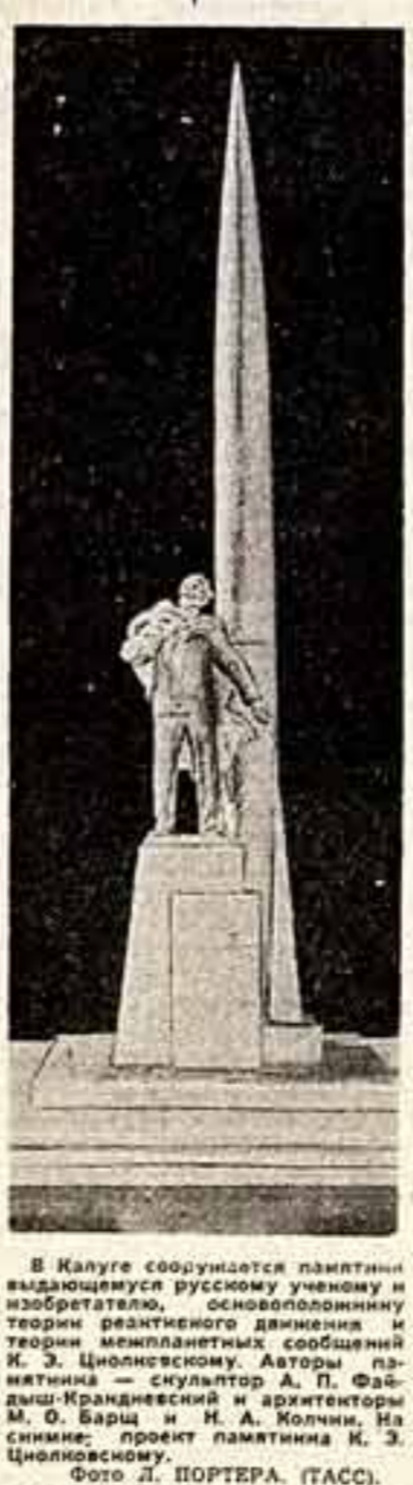
В Калуге сооружается памятник выдающемуся русскому ученому и изобретателю, основоположнику теории реактивного движения и теории межпланетных сообщений К. Э. Циолковскому. Автор памятника — скульптор А. П. Фадеев. Художественный архитекторы М. О. Барш и Н. А. Колчан. На снимке: проект памятника К. Э. Циолковскому.