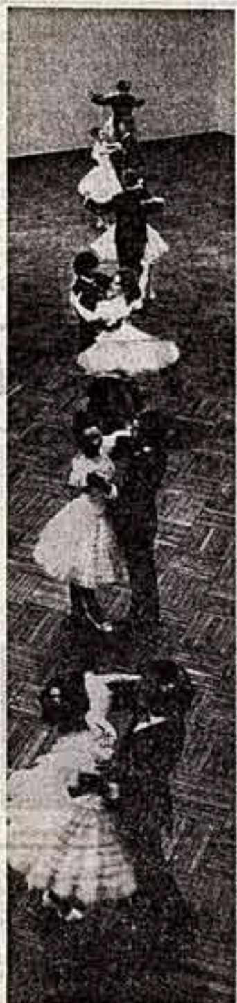
Ансамбль балетного труппы при Доме культуры профтехобразовательной школы в Кемерове.