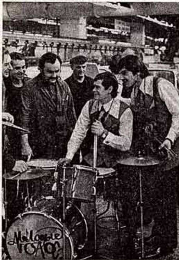
«Молодые голоса» — так назвали свой «социально-инструментальный ансамбль» рабочие сборочного цеха заводского автомобильного завода «Коммунар».

Вот такая позиция, такое постоянное стремление мыслей, фантазий, творчества быть там, где совершаются самые грандиозные, самые принципиальные события времени, — только это и рождает художника. Он сегодня в самой гуще жизни. Он о ней рассказывает людям.