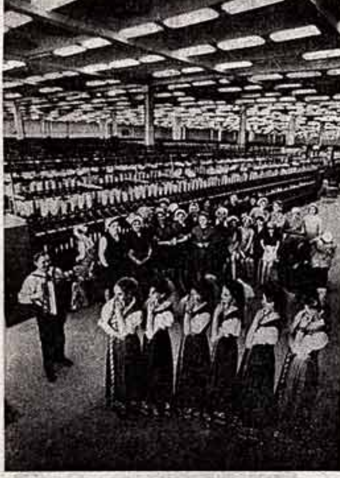
Тираспольский хлопчатобумажный комбинат — молодые предприниматели Молдавии. Текстильщики успешно осваивают производственные возможности и хорошо отлаживают.

Перед выступлением в цехе.