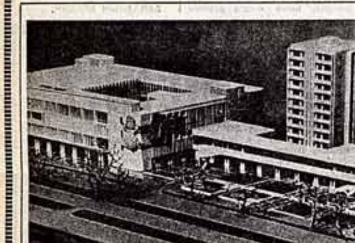
Так будет выглядеть Дом бытовых услуг, который строится в Махачкале. В нем откроются четырнадцать предприятий службы быта.

АНИВА — КОРСАКОВ — ХОЛМСК — ЮЖНО-САХАЛИНСК.