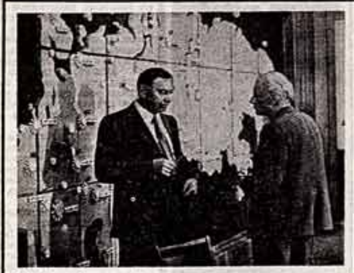
Кадр из фильма «День приема по личным вопросам».

И здесь мы видим, что начало фильма было своего рода обманым ходом, потому что сразу же, едва за ним мы в течение едва ли не