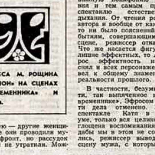
Сцена из спектакля «Шелон» в «Современнике».

В частности, безумие Натя, так выключенное в «Современнике», Эфросом по сути дела отменено. В своем спектакле Катя в своем уме, только вся целиком поглощена воспоминаниями, и дабы мы в этом не сомневались, режиссер выводит на сцену мужа, с которым Натя