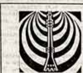
Три дня, с 25 по 27 июня, во Владивостоке показывали картины, представленные на Всесоюзный смотр документальных телевизионных фильмов. Темой показа был наш советский образ жизни.

И все-таки наиболее значительной ценностью труда предстает в тех фильмах, авторы которых лично «работали и создали» смогли провести через третью точку — через борьбу.