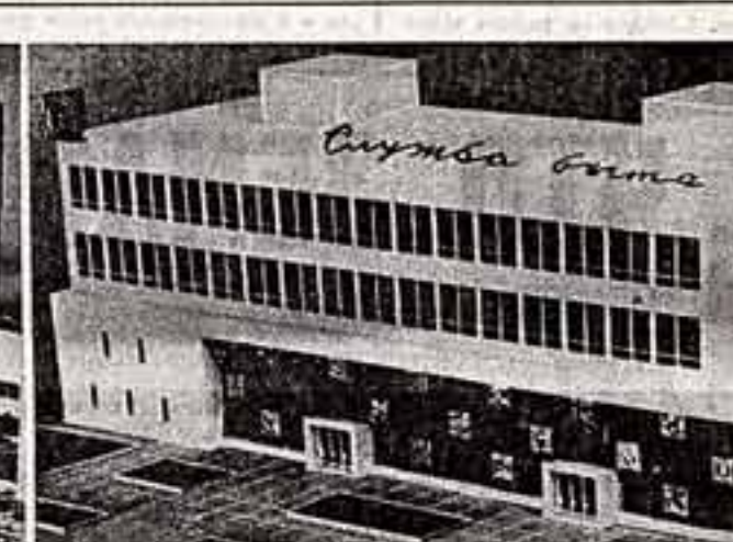
Дом бытовых услуг в городе Зарайске — одно из многих предприятий подобного рода, которые войдут в строй в Московской области.