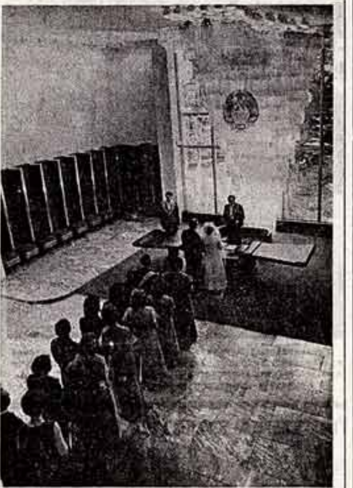
В этом прекрасном, полном света и воздуха, торжественности и счастья Дворце бракосочетаний Вильгельма рождается новые советские семьи.