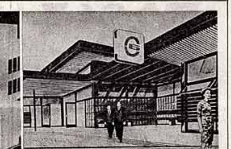
Этот зашифрованный из легких металлических конструкций будет открыт на курорте Минеральные Воды. Его услугами в год воспользуются около трех тысяч отдыхающих.