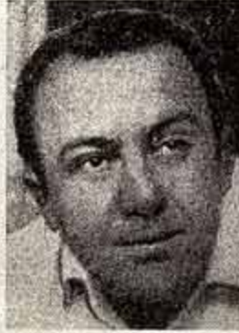
ЧЕРТЕЛОВ ЗАБАИР КОНСТАНТИНОВИЧ, заслуженный художник Грузинской ССР, живописец. Родился в 1924 году в Тбилиси. В 1948 году окончил Тбилисскую академию художеств. С 1967 года — член Союза художников СССР. Автор мозаичных композиций, украинских новых зданий Дворца профсоюзной молодежи в Тбилиси и бассейна на главной площади Мемориального центра в Ульяновске.

«... что имеем, не храним, потерявши — плачем.»