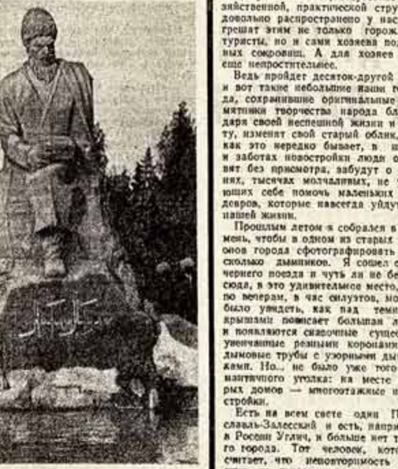
В центре Ашхабада на самом изысканном проспекте Свободы, открыт памятник классному туркменскому поэту Махтумулику. Автор — скульптор В. Попов.