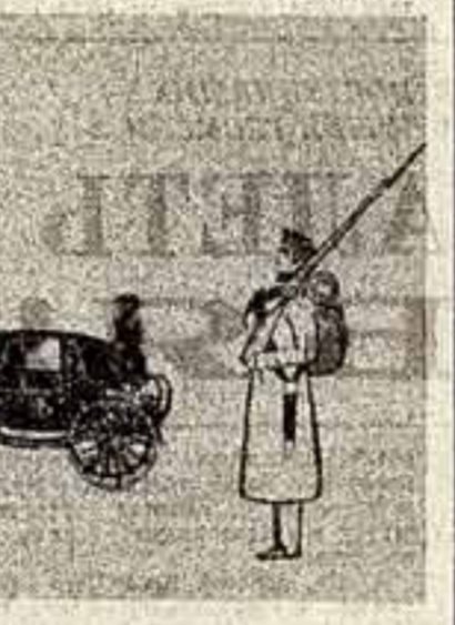
Кадры из фильма «Юноша Фридрих Энгельс». («Портреты в письмах»).