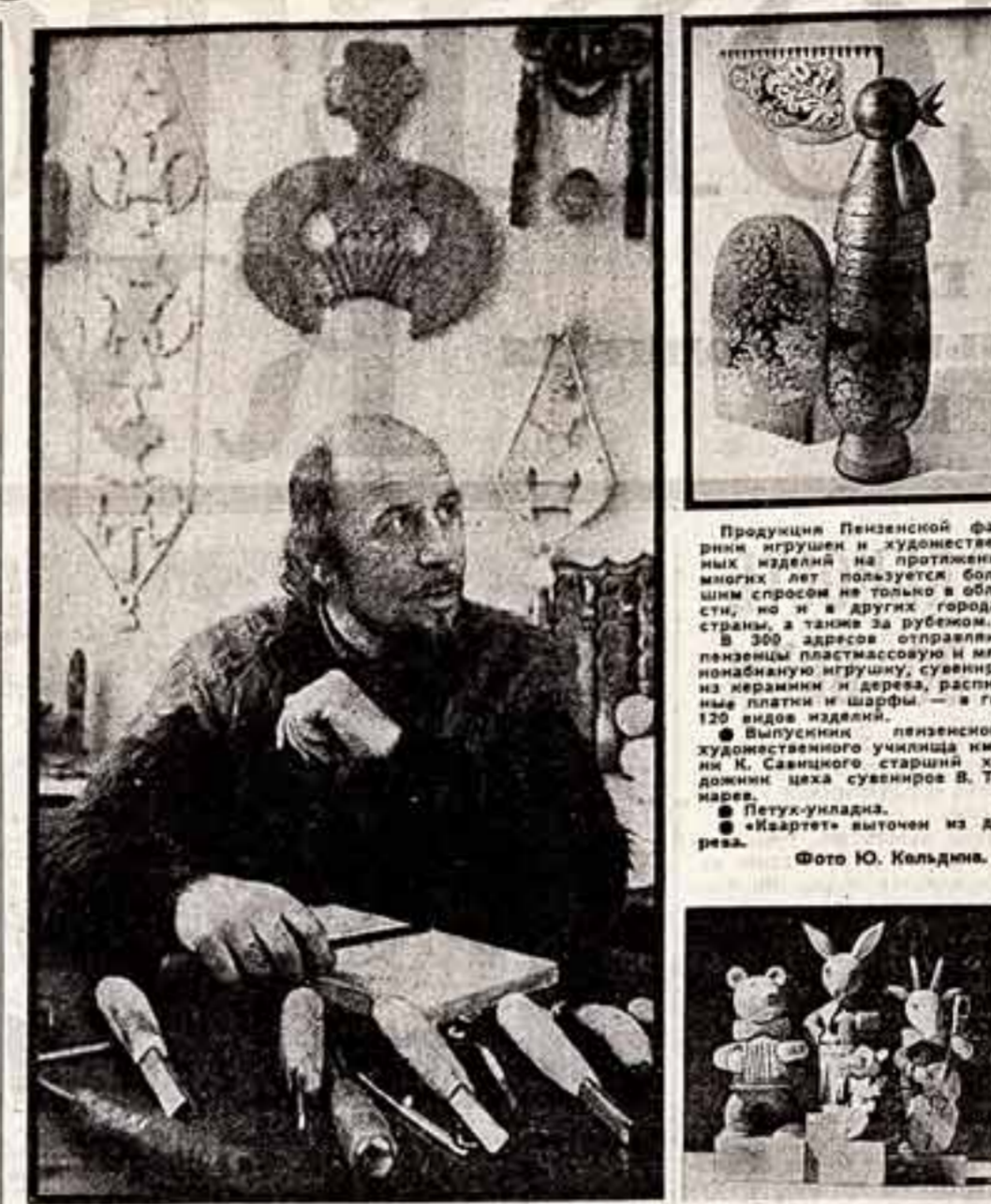
Продукция Пензенской фабрики игрушек и художественных изделий на протяжении многих лет пользуется большим спросом не только в области, но и в других городах страны, а также за рубежом.