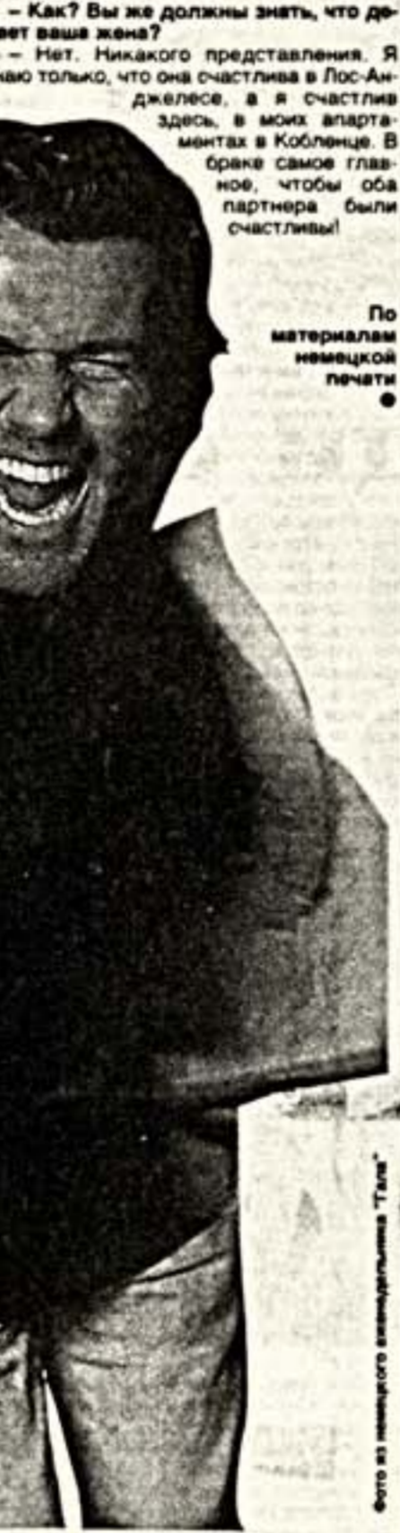
По материалам немецкой печати