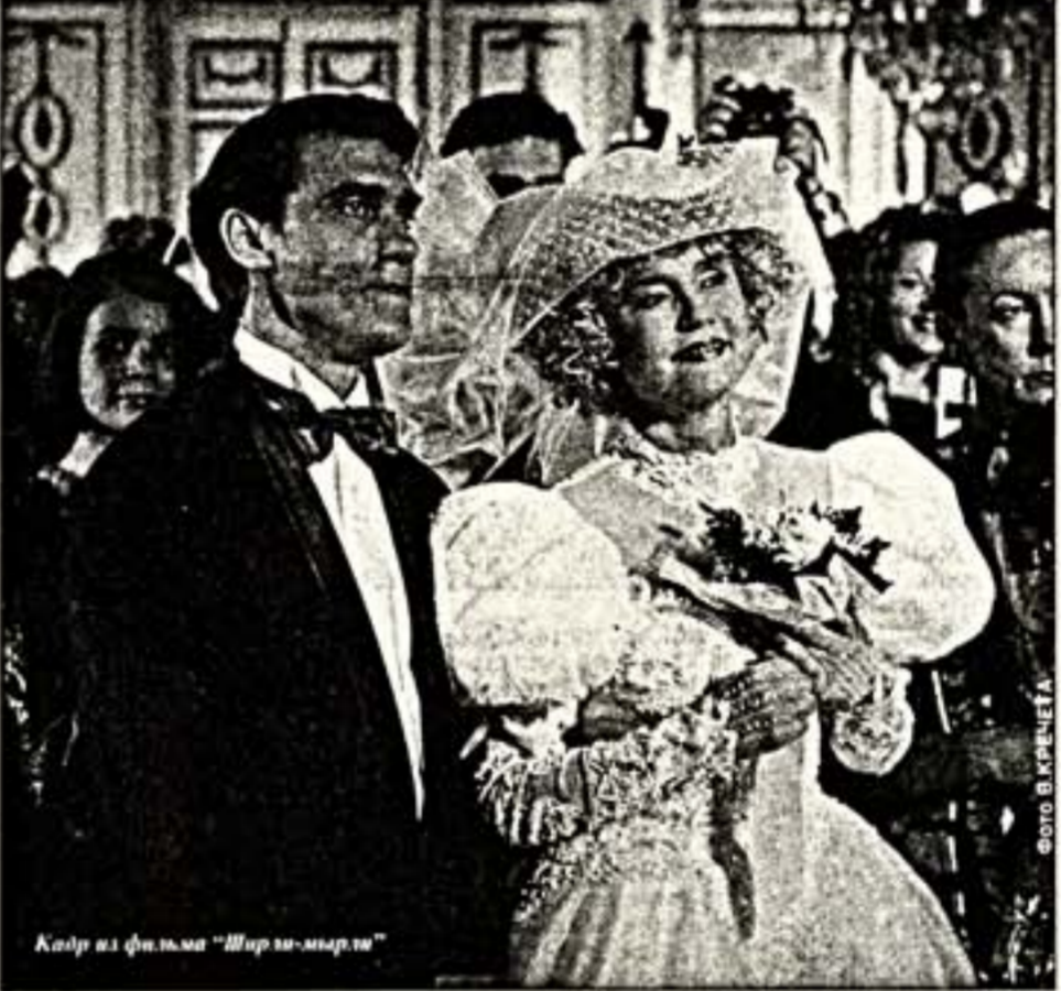
Кадр из фильма "Ширли-мырли"