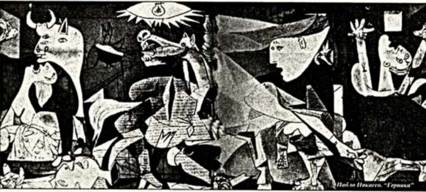
Павло Пикассо. “Герника”