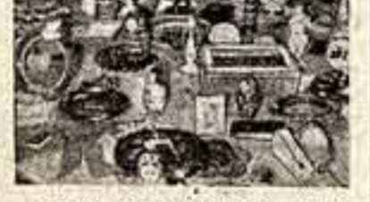
Члены фестивального клуба Фрунзенского района Москвы готовят подарки делегатам фестиваля.

В одном из залов клуба устроена временная выставка подарков. Временная потому, что скоро эти чу-