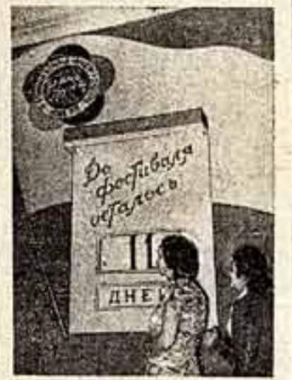
В фестивале Международного подготовительного комитета стоит Фестивальный календарь.

Конкурс! Сколько их было проведено в предшествующие дни во всех странах мира! Литературные, художественные, музыкальные... Но вот и они заканчиваются, а большин-