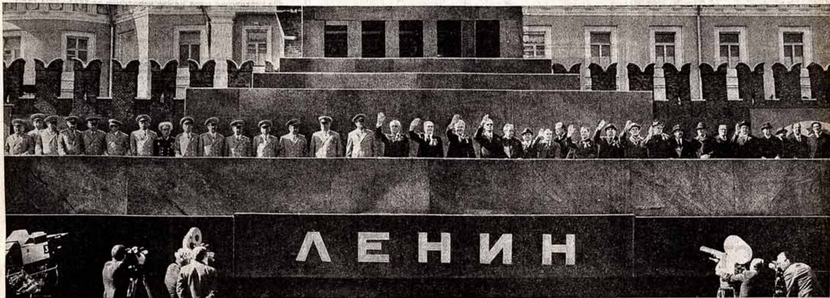
МОСКВА. Красная площадь. 1 мая 1975 года.