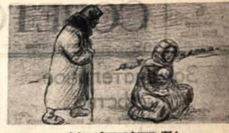
Степленко. «Отшельник в пустыне». 1916 г.

Нужно бороться с лодырями, прогульщиками, летунами, антинародное дело. Укрепим трудовую дисциплину.