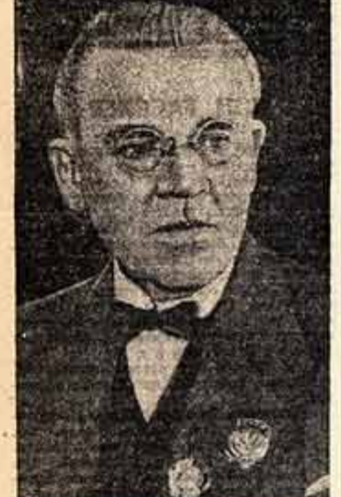
Передовики шефства работников искусства над Рабоче-Крестьянской Красной Армией и Военно-Морским Флотом. На фото: народный артист СССР И. М. Москвин