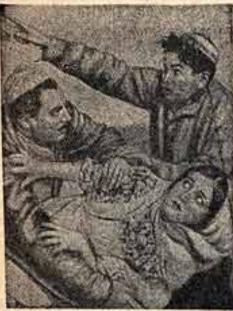
Татарский оперный театр в Казани открывает свой первый сезон премьерой оперы...