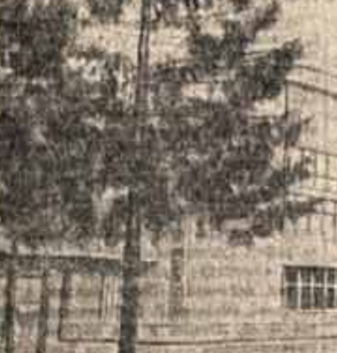
Внешний вид нового театра при Дворце культуры завода им. Гербунова в Москве

Нужно бороться с лодырями, прогульщиками, летунами, антинародное дело. Укрепим трудовую дисциплину.