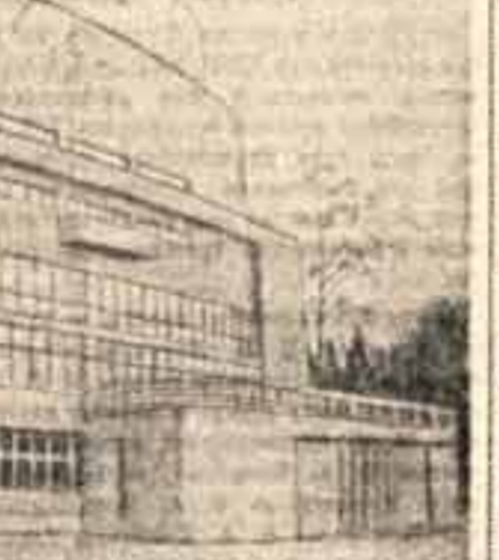
Внешний вид нового театра при Дворце культуры завода им. Гербунова в Москве

Нужно бороться с лодырями, прогульщиками, летунами, антинародное дело. Укрепим трудовую дисциплину.