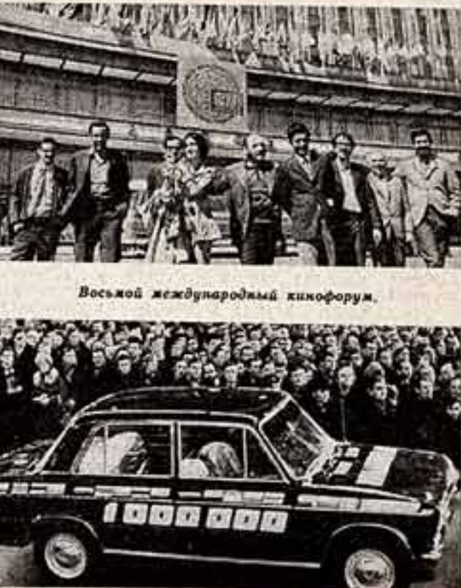
На ВАЗе миллионные автомобили!