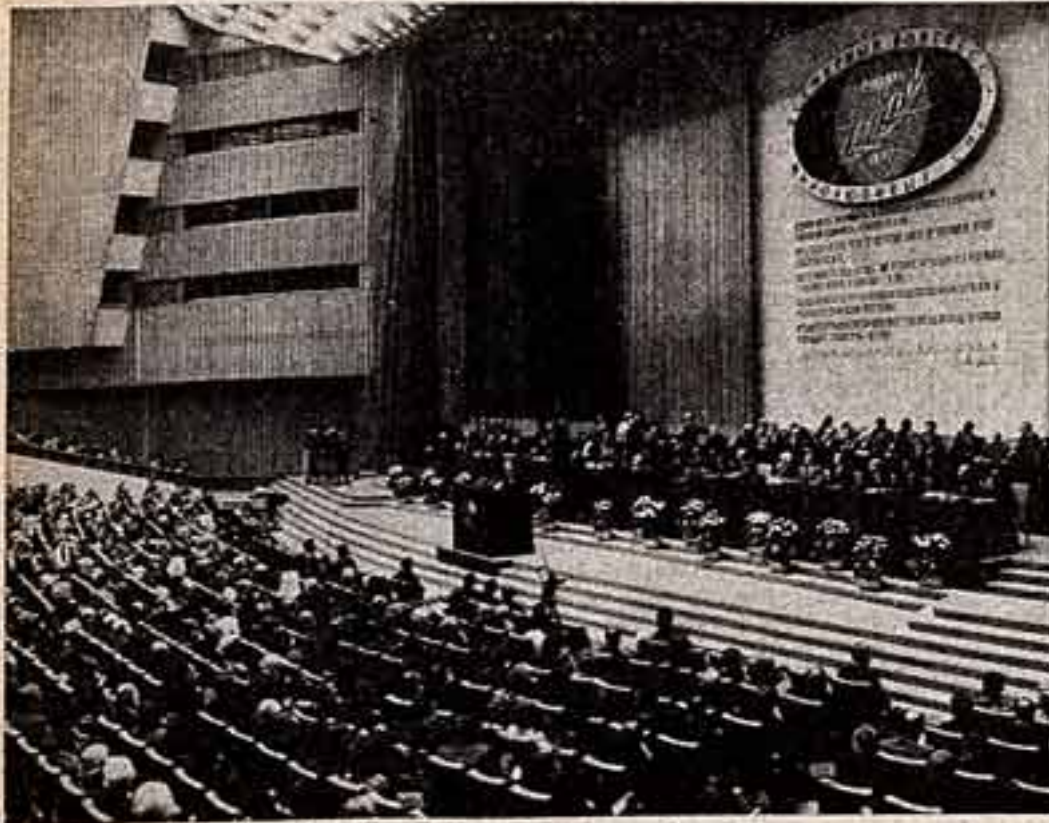
На Всесоюзном конгрессе миролюбивых сил.