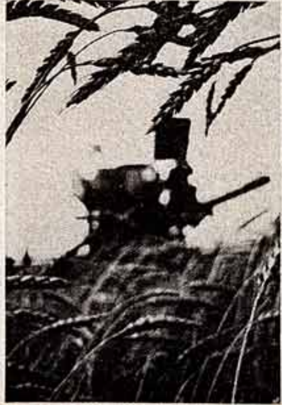
Большой хлеб Родины!