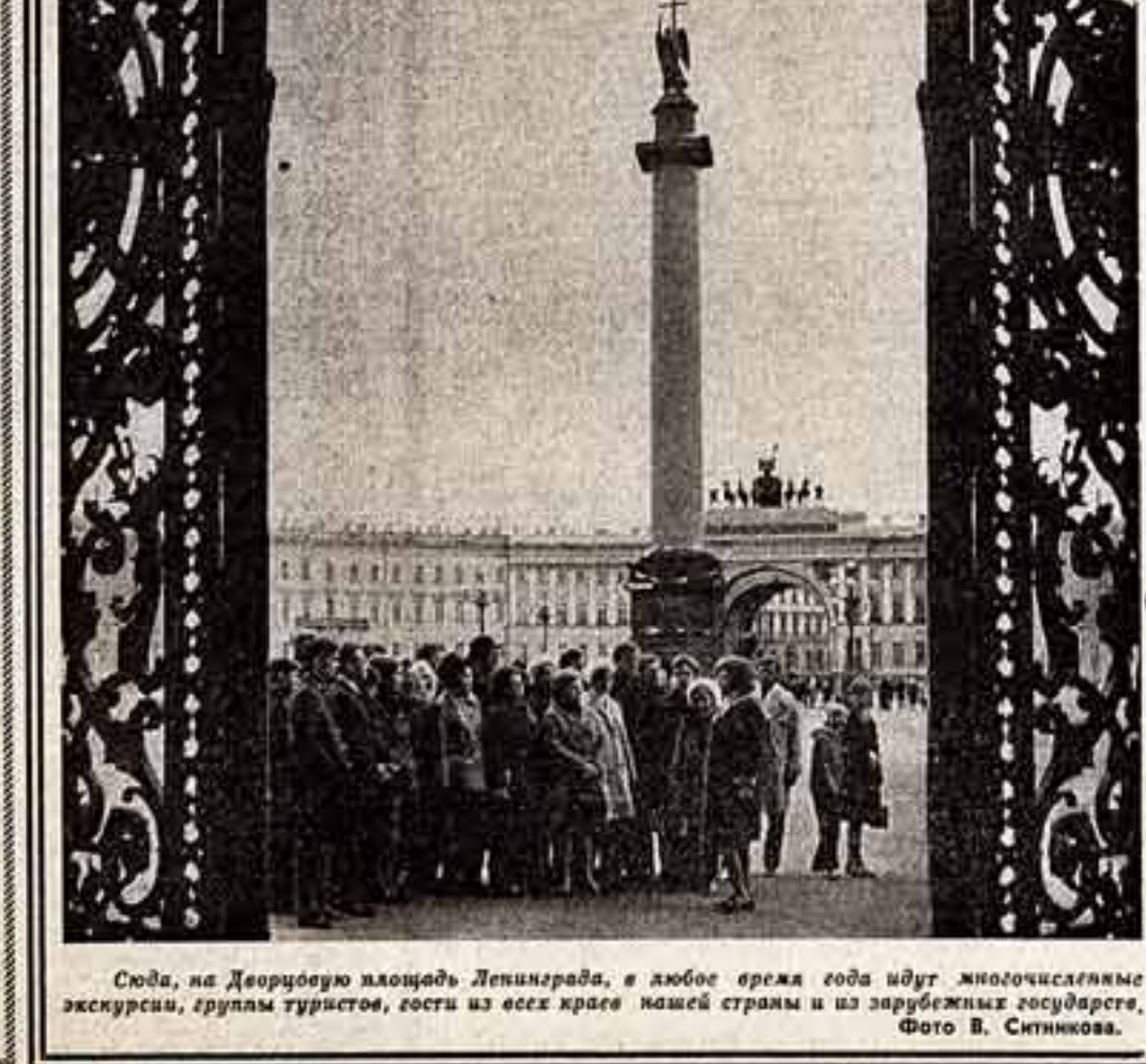
Сюда, на Дворцовую площадь Ленинграда, в любое время года идут многочисленные экскурсия, группы туристов, сотни из всех краев нашей страны и из зарубежных государств.