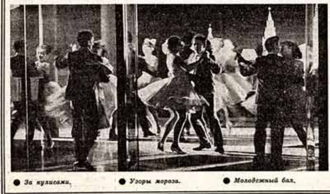
За кулисами, Узоры моря, Молодежный бал.