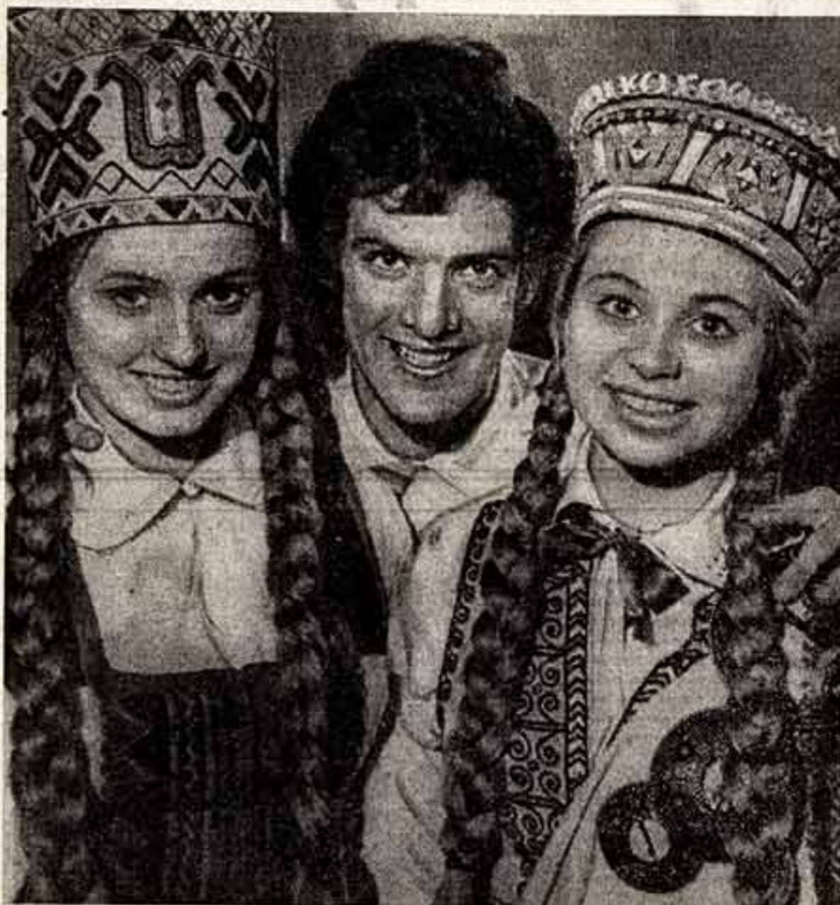
Государственный ансамбль танца Латвийской ССР широко известен не только в своей республике, но и далеко за ее пределами. В программе этого яркого и самобытного коллектива — латвийские народные и современные танцы, хореографические картины из жизни народов СССР и других стран мира.

В эти дни киноматографы Центральной студии документальных фильмов завершают монтаж кинолент, повествующих о пребывании Генерального секретаря ЦК КПСС товарища Л. И. Брежнева в Омске, Алма-Ате и Ташкенте.