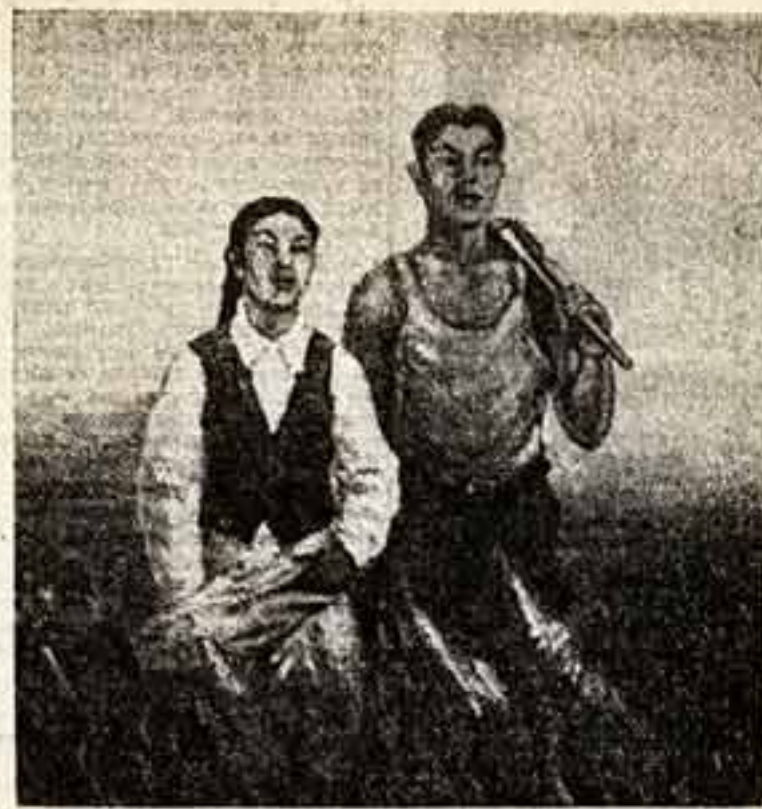
Р. Саев. «Путь труда». Выставка изобразительного искусства Казахской ССР.