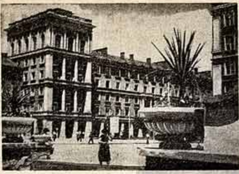
Димитровград. Кадр из художественно-документального фильма «Город молодости», поставленного кинолюбителями клубом «Димитровград».

НОВЫЙ сезон в театрах Народной Республики Болгарии отмечен значительным оживлением, появлением ряда интересных произведений, отражающих борьбу народа за социалистическое преобразование страны, за становление и развитие новых отношений в труде и быту. Выступая под знаменем партийности и реализма, театры республики настойчиво укрепляют связи с жизнью народа, утверждают на сцене современность, несут в массы передовые идеи нашей эпохи.