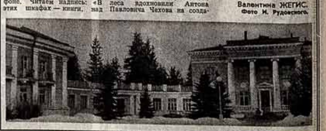
Наш спец. корр. Ленningradskaya обл., Таджикская ССР.