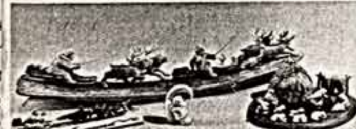
На многих выставках экспонируются изделия мастеров Магаданской фабрики народных художественных промыслов и сувениров. В числе потребителей продукции предприятия — Япония. Недавно заключен контракт на поставку изделий в Италию. Развита традиционная для этих мест искусство, резчики по кости создают уникальные реалистические композиции о жизни северных народов.