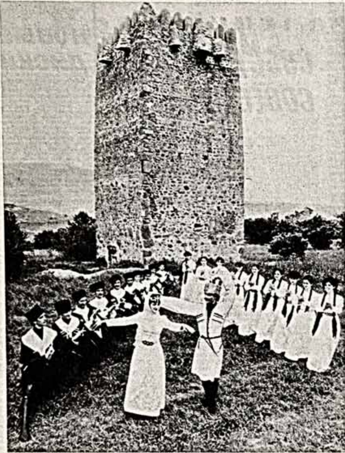
В первые зарубежные гастроли отправляются 80 самодеятельных артистов — танцоров, музыкантов, вокалистов, представляющих народный ансамбль песни и танца «Иристон» Юго-Осетинской автономной области. Их маршрут — Болгария и Румыния. Концертная программа лауреата все союзных фестивалей народного творчества ансамбля «Иристон» состоит из осетинских, грузинских, русских, абхазских, аджарских и набардинских песен и танцев.