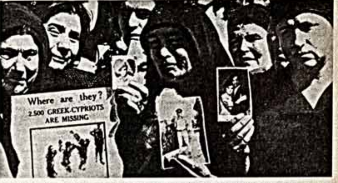
Независимая боль разделенного Кипра. Греческие матери оплакивают судьбу 2.500 бесследно исчезнувших родных и близких в 1974 году...