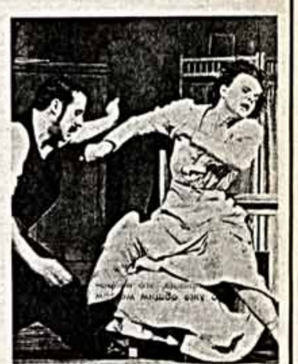
Офелия в спектакле Бергмана погибает не только потому, что не перенесла смерти отца. Она не выдержала груза зрелища, перед ней предстали...

тот же раба иллюзорной идеи независимости от мужчины). Отчетливый и сильный протест против насилия над душой, против духовного рабства обуславливает своеобразную просветленность трагического спектакля.