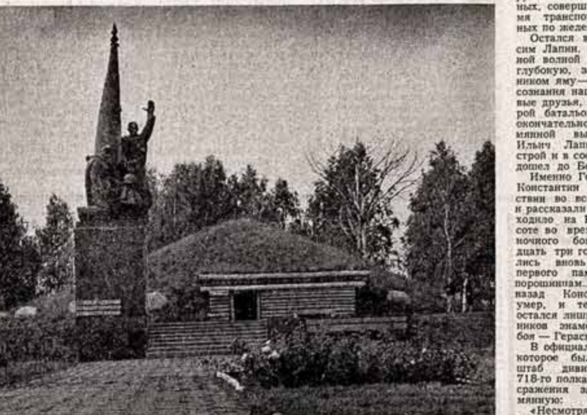
Памятник на Безымянной высоте.