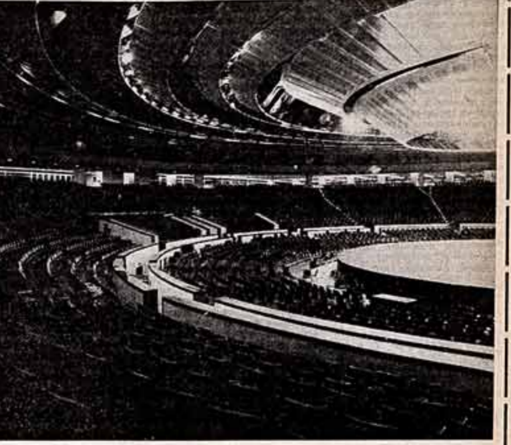
Таллин. Дворец культуры и спорта.