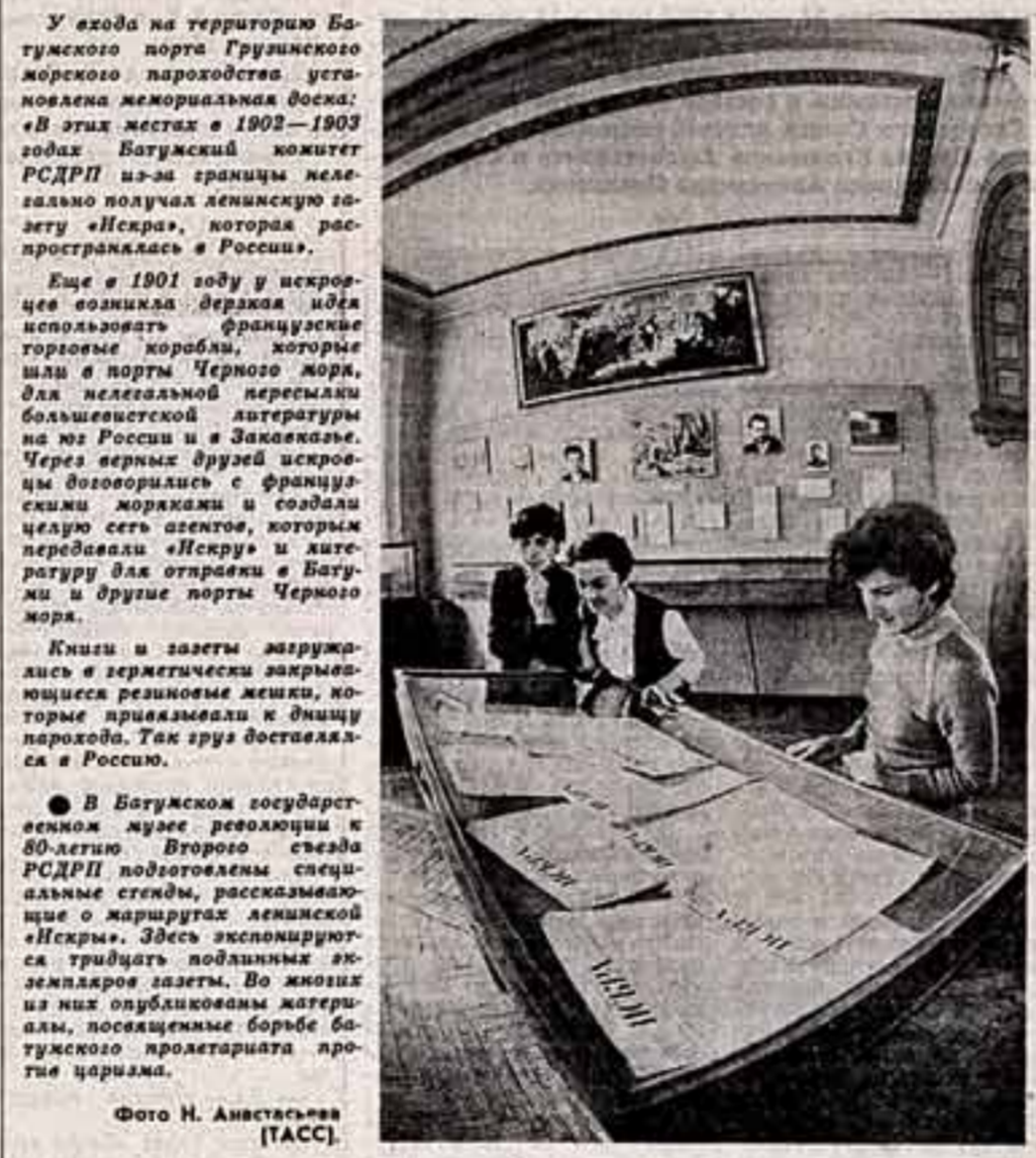
У входа на территорию Батумского порта Грузинского морского пароходства установлена мемориальная доска: «В этих местах в 1902—1903 годах Батумский комитет РСДРП из-за границы нелегально получал ленинскую газету «Искра», которая распространялась в России». Еще в 1901 году у искровцев возникла идея использовать французские торговые корабли, которые шли в порты Черного моря, для нелегальной пересылки большевистской литературы на юг России и в Закавказье. Через верных друзей искровцы договорились с французскими моряками и создали цепочку сетей, по которым «Искра» и литература для отправки в Батум и другие порты Черного моря. Книжки и газеты погружались в герметически запечатанные мешки, которые привязывали к днищу парохода. Так груз доставлялся в Россию. В Батумском государственном музее революции и 80-летию Второго съезда РСДРП подготовлены специальные экспозиции, посвященные маршруту «Искры». Здесь экспонируются тридцать подлинных экземпляров газеты. Во многих из них опубликованы материалы, посвященные борьбе батумского пролетариата против царизма.

стии. Думаешь, что настало время выходить из музея на улицы, площади, в жилые интерьеры, на заводы и фабрики, как это давно делается в Прибалтике.