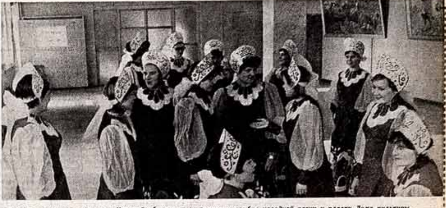
Любовь в холмах «Россы» Курской области выступают ансамбль народной песни и пляски Дома культуры.

Этери ГУГУШВИЛИ, доктор искусствоведения, Тбилиси.