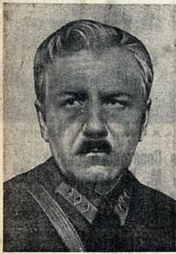
Артист Щукин в роли Мальчука