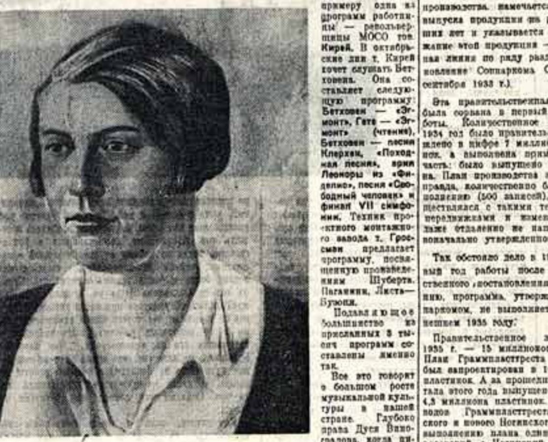
«Дуса Виноградова» Вторая областная художественная выставка в Иваново

В клубе не только живут, но и работают. В клубе скачки, кино, танцы, музыка, и даже цирк.