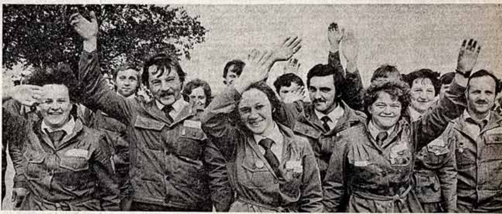
Молодежь Стран Советов всегда готова на труд и на подвиг.