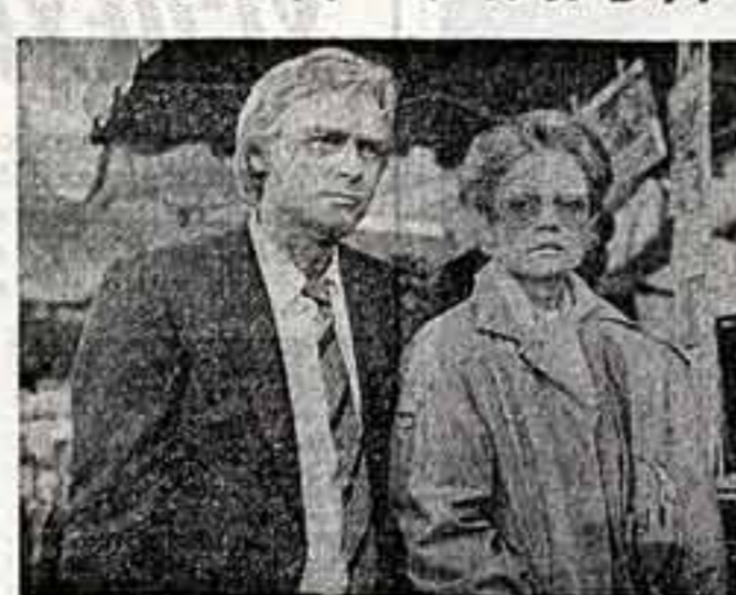
Кадр из фильма «Берег»

И что может быть еще более впечатлительным — все сказано образами. Ведь образ в искусстве — это образ, который борется страстно, с благородной гуманностью, всем своим существом, всем своим сердцем. Это фильм о том, как целой нечеловеческой мукой выстрадан нынешний мир.