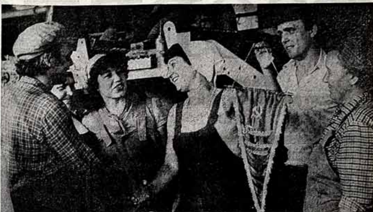
Московская фабрика № 3 производственного объединения «Восход» специализируется на выпуске блокнотов, школьных тетрадей, альбомов. Сейчас предприятие решает задачи максимальной механизации и автоматизации операций и процессов производства. В результате комплексного подхода удалось повысить производительность труда по сравнению с прошлым годом почти на 5 процентов.

М. БРИМАН, Д. МАМЛЕВ, и другие спец. корр. МИНУСИНСК — АБАНАН, Красноярский край.