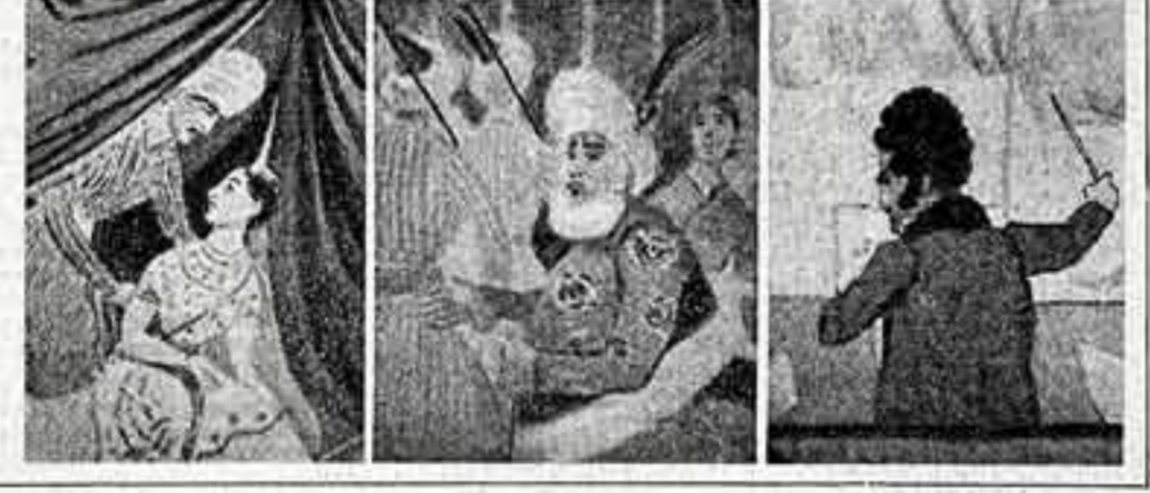
Ни слова ты сказать не смей... А сам, прости ему, всевышний, Ведь уж какой прелюбодей!

Художник-любитель сделал акварельный рисунок, запечатлевший спектакль в петербургском Большом театре. Благодаря этому рисунку, публикуемому впервые, мы можем восстановить один из дней 1837 года.