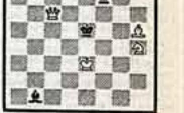
Мат в 2 хода