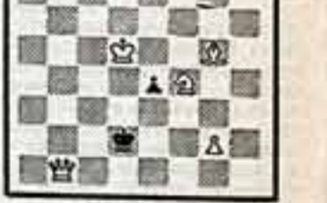
Мат в 2 хода

Ваши решения присылайте в течение десяти дней на отдельный конверт, делая пометку «Шахматы» и указывая номер задания.