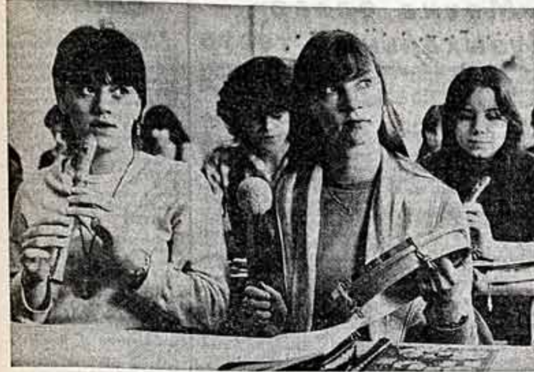
Широкое строительство в ГДР детских учреждений...