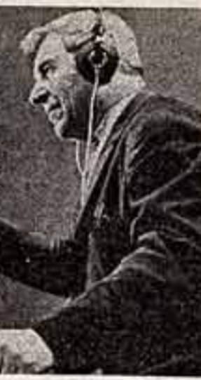
Наш соб. корр. Иркутская область.