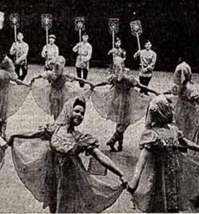
Двадцать лет радует зрителей своим искусством самодельный народный ансамбль песни и танца «Ваталика»...

проблему электротехники (тоже две с половиной тысячи — деньги немалые), его сместили и убрали с глаз долой в помещение с неподходящей температурой?