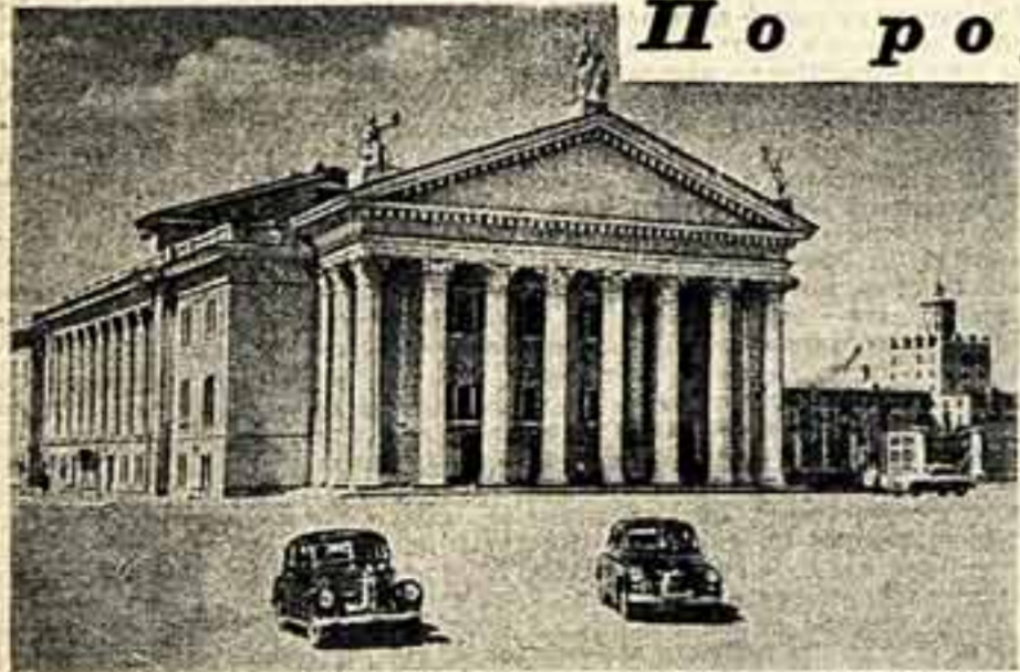
Все более прекрасным становится Сталинград — город бессмертной славы. Родаются кварталы и целые новые многоэтажные дома, общественные здания, скверы. Благоустроена набережная Волги в центральной части города. На набережной сооружена спускающаяся к Волге величественная лестница из гранита, увенчанная скульптурой. В день, когда флагманский теплоход «Иосиф Сталин», совершивший свой исторический рейс, подошел к Сталинграду, в городе-герое состоялось открытие нового здания Областного драматического театра имени Горького. Театр расположен на центральной площади города. Его главный фасад украшает мощный восьмиколонный портик. Хорошо отделаны и украшены зрительный зал, фойе, вестибюль. Здесь много лепнины, бронзы, хрусталя и красивых тканей. На снимке: здание Областного драматического театра имени Горького в Сталинграде. Автор — архитектор И. Курейков.

Театральный коллектив железнодорожного Дворца культуры имени Арутюна осуществил постановку оперы Гуляк-Артемонской «Зарюшка за Дунайем». Опера будет показана в рабочем Янского долготного комбината, в Доме культуры имени Ленина в Славянске, в клубах других населенных пунктов.