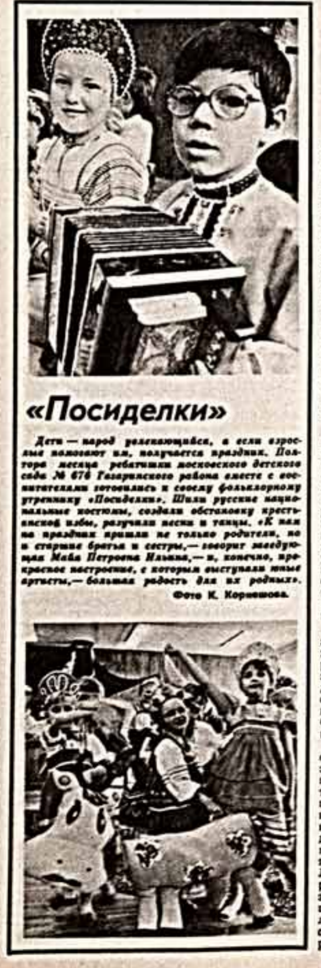
Дети — народ реализующийся, а если взрослые позволяют им, возмужает предки. (caption continues)