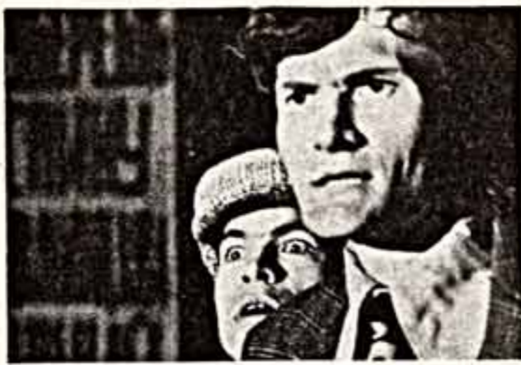
Московское художественно-театральное товарищество