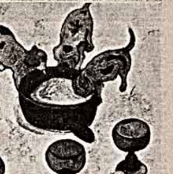
● Стога. ● Здравствуйце, господа Гоген. ● Натюрморт с тремя щенками. ● День бога.