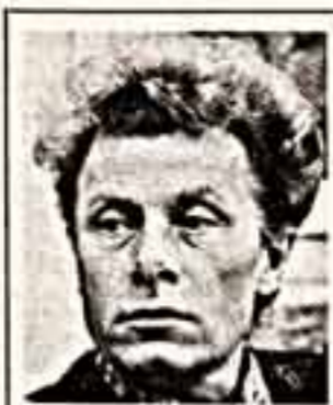
Лев Николаевич ГОЛОВИННИЧ , академик-секретарь Сибирско-Дальневосточного отделения Академии художеств СССР, народный депутат СССР.

Таланты и трудолюбие, совесть и чист как... (caption continues)