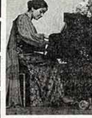
Ю. БЕЛЫНОВА (ТАСС).