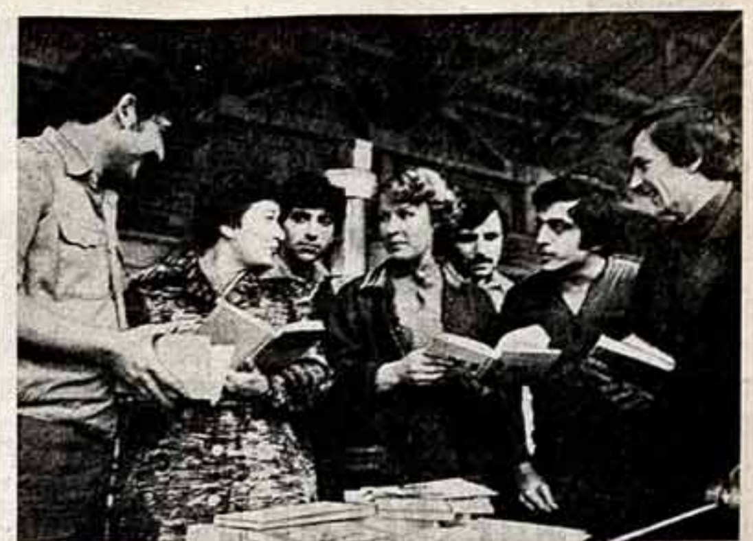
Путь длиной в век прошлой Баминский завод имени Монтана...