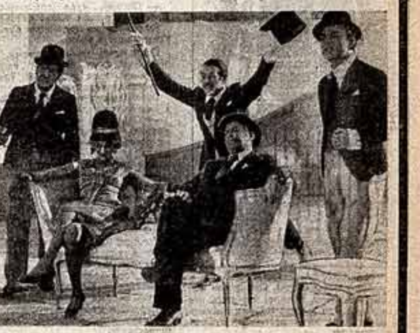
Кадр из фильма «Мистер Танстер».