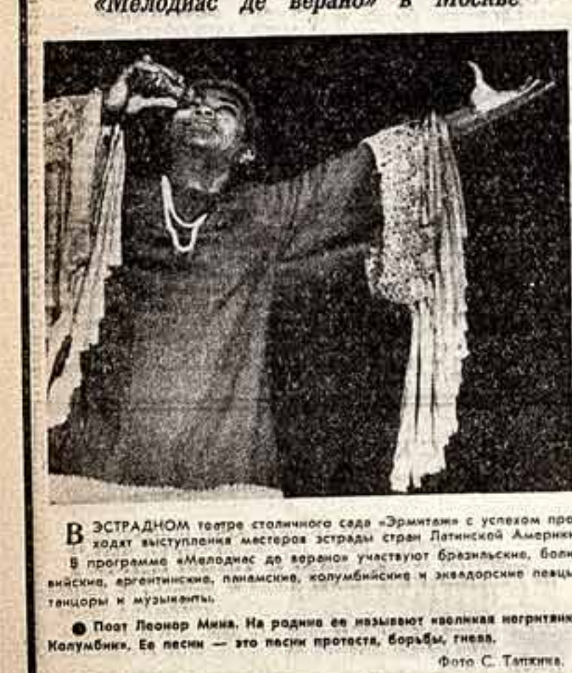
В ЭСТРАДНОМ театре столичного сада «Эрмитаж» с успехом проходит выступление мастера эстрады стран Латинской Америки. В программе «Мелодия де верано» участвуют бразильские, боливийские, аргентинские, перуанские, колумбийские и эквадорские певцы, танцоры и музыканты.