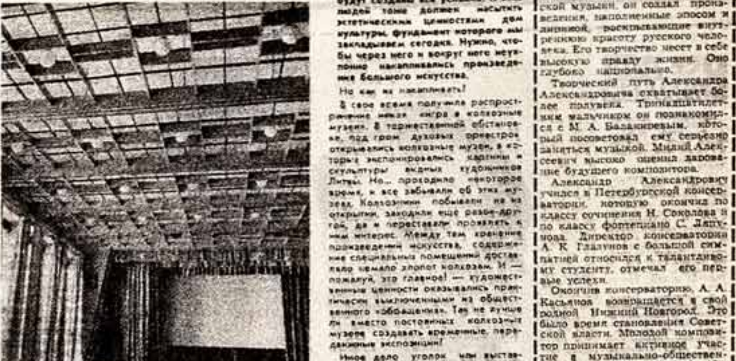
Здание Дома культуры колхоза «И коммунизм» (Вильнюсский район). ● Гостиная Дома культуры колхоза «Новая земля» (Кайслюкский район). ● Зрительный зал в Доме культуры Мешкуно (Шуляйский район).