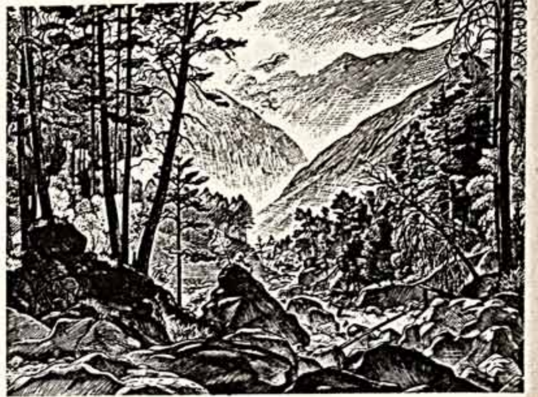
А. Готина. Город в полукруге. Пейзаж.