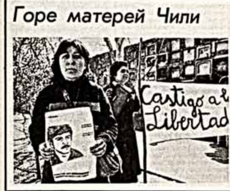
Горе матерей Чили

реакционных сил, в том числе тех, что вдохновляются на «подвиги» военно-промышленным комплексом, его гигантскими доходами. Надо ясно представлять себе, что у нового мышления есть упорные и могущественные враги, сплотившиеся еще в ту пору, когда «лестредам», боссам военной промышленности и другим отъявленным реакционерам в Соединенных Штатах кружило голову пьянение вином «американского мышления».