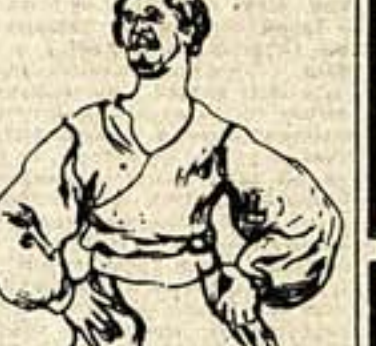
Константино — Бенито

сказать, в зрительном зале взрослых было не меньше, чем детей, и трудно решить, кому он больше понравился — взрослым или детям.