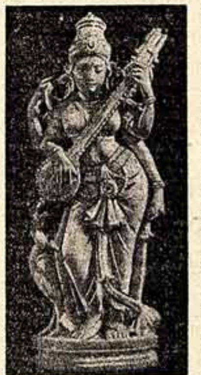
Сарасвати — богиня знания и музыки. Словесная ность.

Экспозиция индийского раздела в музее заканчивается картинами и графикой современных художников, собрание которых здесь