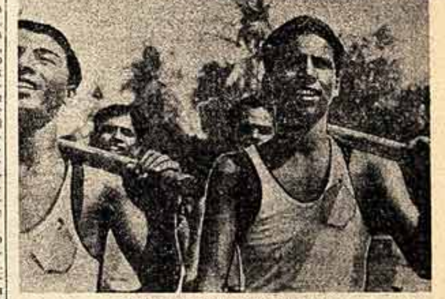
Кадр из кинофильма «Утро Индии».