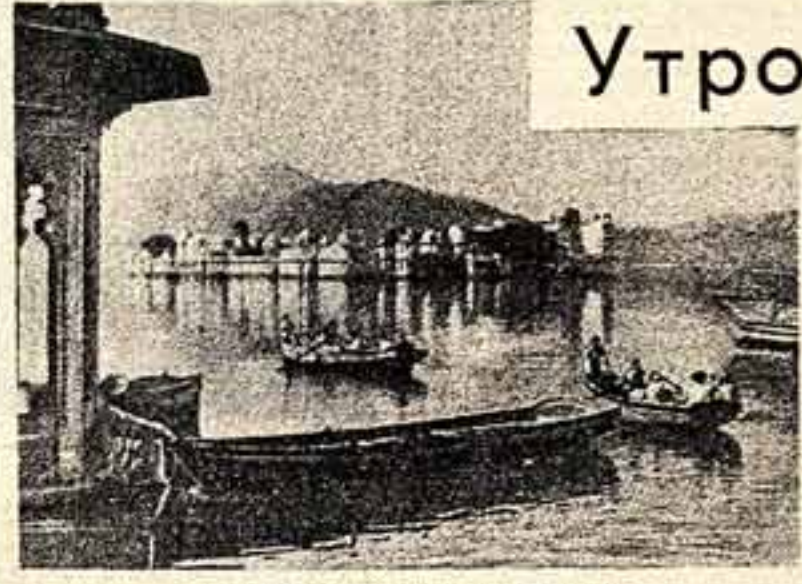
Кадр из кинофильма «Утро Индии».

Неостаточно подчеркнуть важность всемирной кампании за мир, борьбы за непорушение войн. Наиболее важная сторона этой кампании — укрепление мира. Культурное сотрудничество между народами подчеркивает именно эту сторону. Как хорошо осуществлять эту задачу правительства и народы Индии и СССР! Другие народы будут обязаны им за инициативу в осуществлении принципа сосуществования на основе международного культурного сотрудничества.