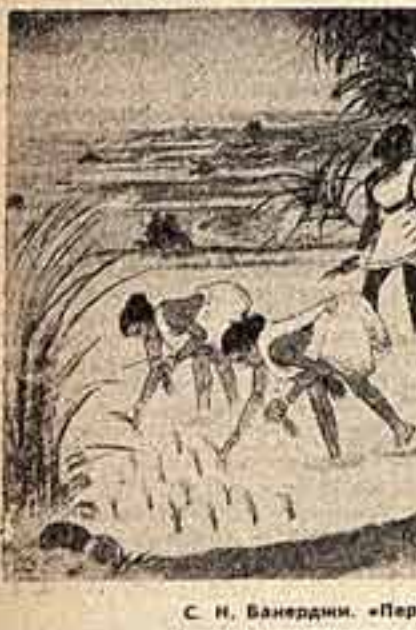
С. Н. Ванердини. «Пересадка рисовой рассады».

можных материалов — дерева, кости, камня, глины, драгоценных и простых металлов, в частности из хлопка, шерсти и шелка. Народные умельцы превращают все это в прекрасные изделия. Искусство это всюду окружает человека, обогащает его вкус, дает новые силы в труде.