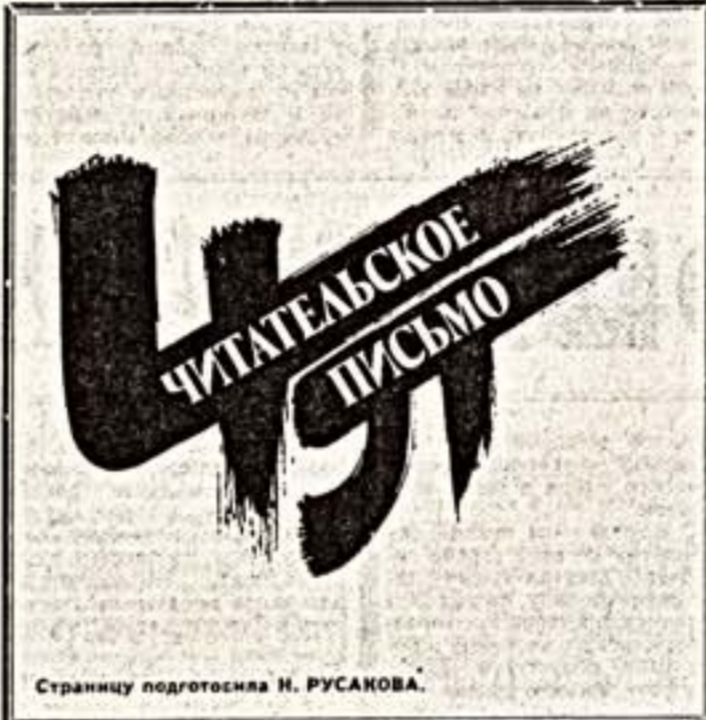
Страницу подготовила Н. РУСАКОВА.