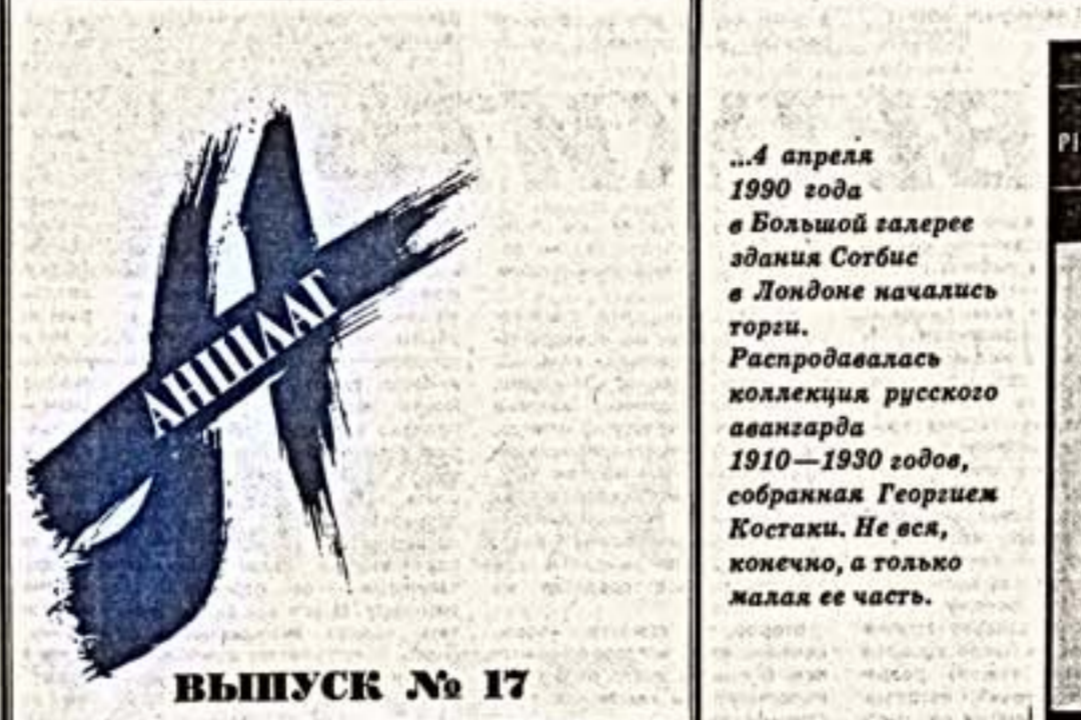
ВЫПУСК № 17

В один и тот же день одновременно в Югославском культурном центре в Москве, в галерее «Арт» в Волгограде, в галерее «Арт» в Грозном и в галерее югославского культурного центра в Париже и в галерее «АР» в Бресте осуществлялся проект художников-авангардистов Евгения Деминского «Линии от Урала до Атлантики».