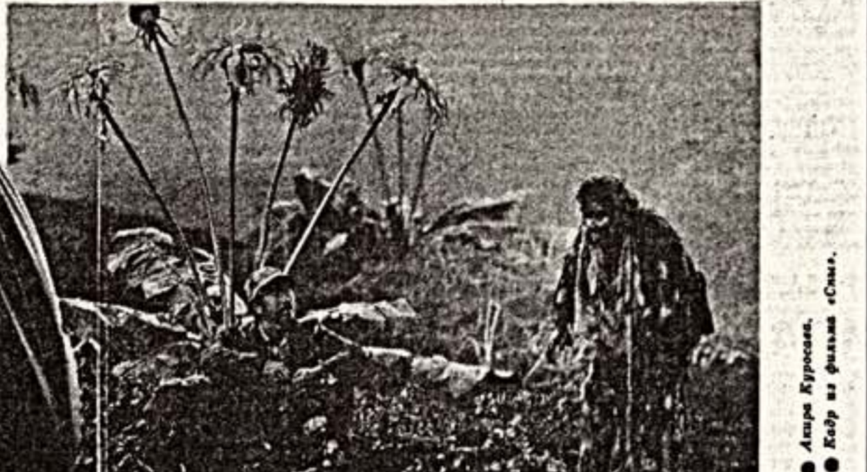
Акира Куросава. Кадры из фильма «Сэнсэ».

К ТО РАБОТАЕТ с ним, зовет его «сенсэй», мастер. Или же «император» — с намеком на величие и его аристократичным манерам и взрывам позитива царственного гнева. Такие мэтры западного кино, как Спилберг и Коппола, Лукас и Скорсезе, признали, что они для них образцы. Они используют в своей работе его приемы. (Так, например, «Звездные войны» Лукаса родились под влиянием фильма «Трое недогеды в скроути крепости» Куросавы).