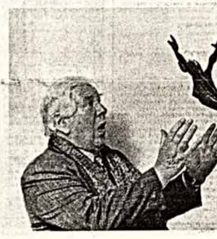
Питер Устинов в роли Лоренцо

— Я попросил бы его авторский текст на мой роман. — И ничего больше! — Нет, я очень скромный. Я подожду бы, чтобы он обратился ко мне.