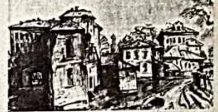
Новые российские предприниматели покупают произведения искусства и тем самым делают искусство туджинским, особенно молодым, жить и работать. Хорошо и то, что приобретенные картины показывают на выставках, а не прячут в сейфах, как надежный во все времена капитал.