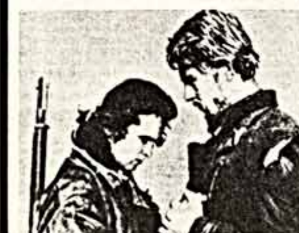
Эти кадры из фильме «Сорок первом» и «Летят журавли» давно стали классикой, вошли во все киношколки и кинолюбители.

Достоинство книги — проинкование в творческую лабораторию М. Ромма. Сохраняющиеся материалы, воспоминания, записи личные беседы позволяют восстановить ощущение сложности и ответственности принимаемых ре-