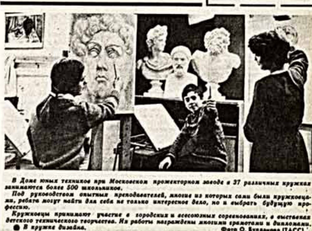
В Доме юных техников при Московском проекторном заводе в 37 различных кружках занимаются более 500 школьников. Под руководством опытных преподавателей, многие из которых сами были кружковцами, ребята могут найти для себя не только интересное дело, но и выбрать будущую профессию. Кружковцы принимают участие в городских и всесоюзных соревнованиях, а выставкам детского технического творчества. На работы награждены многими грамотами и дипломами.