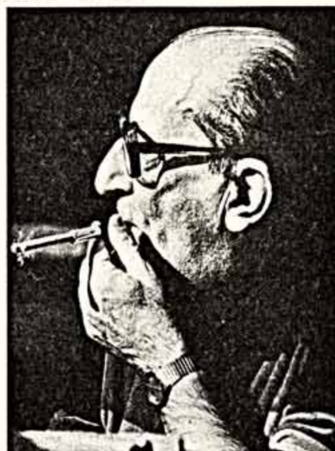
Георгий Товстоногов.