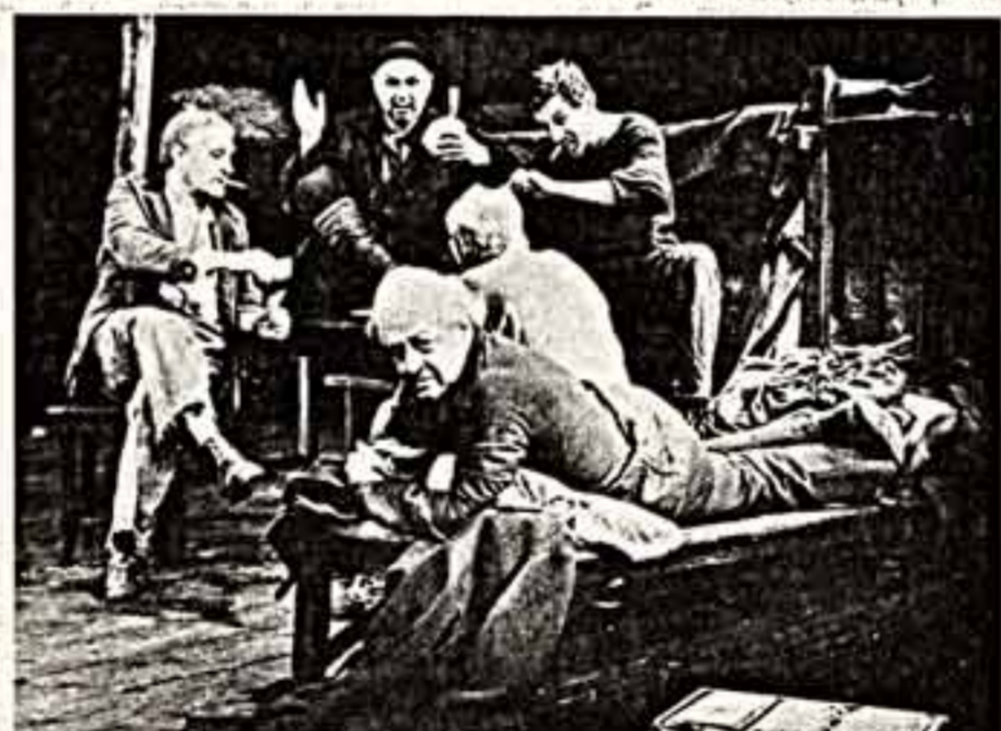
Сцена из спектакля «На дне».