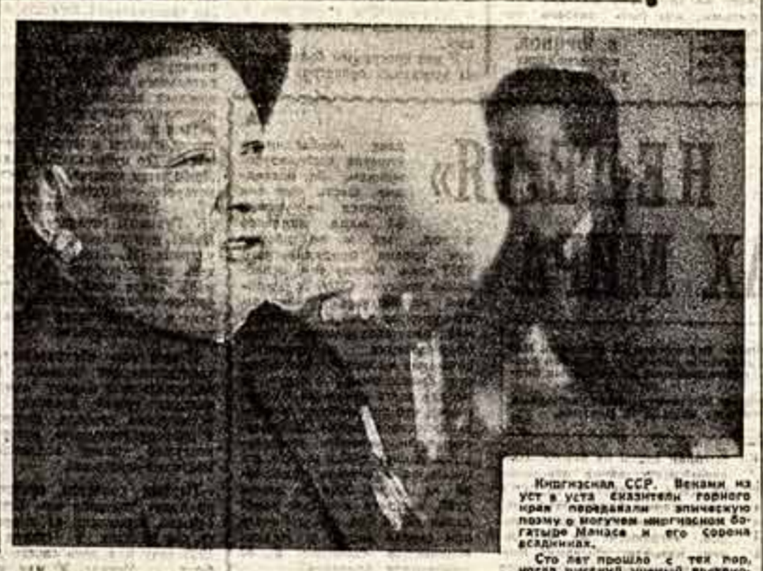
Иркутская ССР. Вениамин из уст в уста передаётся эпическая поэма о могучем индиганском богатыре Манясе и его соратнике...