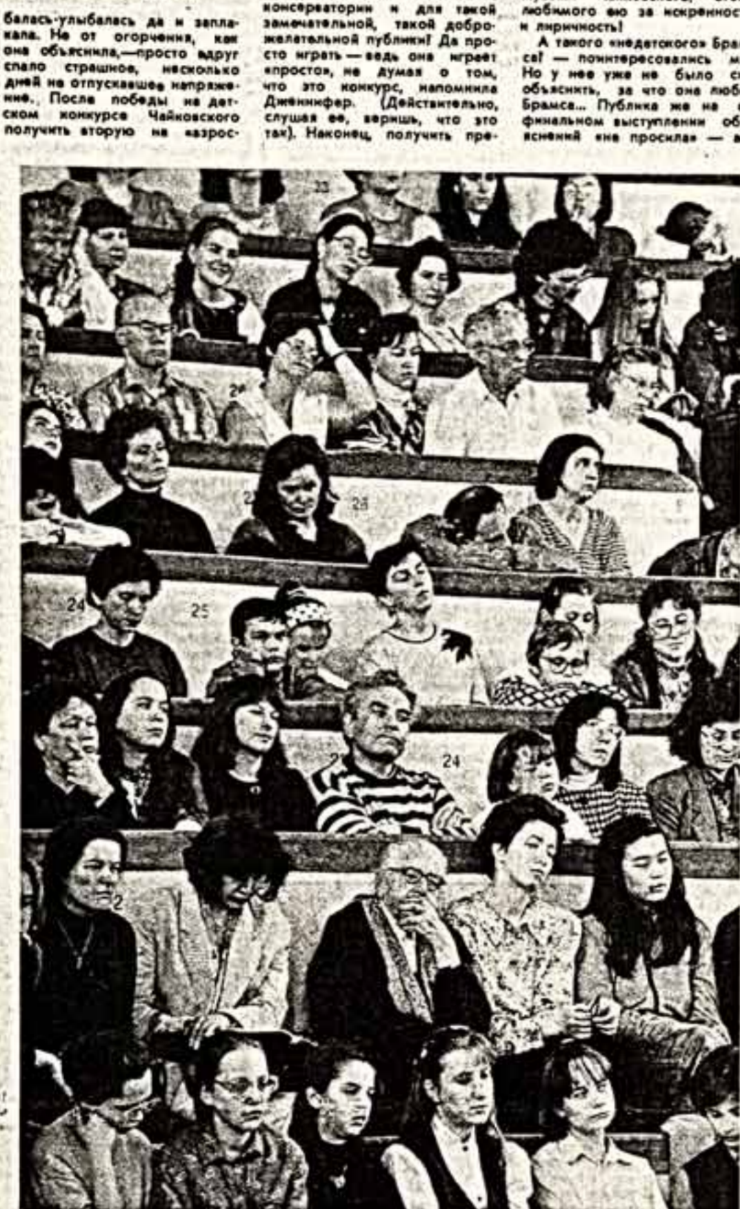
● Еще один «участник» конкурса — публика!

лома — разве плохо? А играть в Большом зале Московской консерватории и для такой замечательной публики! Да просто играть — ведь она играет «просто», не думая о том, что это конкурс, напоминает Дженифер. (Действительно, слушая ее, видишь, что это так). Наконец, получила премию за лучшее исполнение музыки Чайковского, столь любимого ею за искренность и яркость! А такого «недетского» Брамса! — поинтересовались мы. Но у нее же не было сил объяснить, за что она любит Брамса... Публика же не в финальном выступлении объявленной «не просила» — ап-