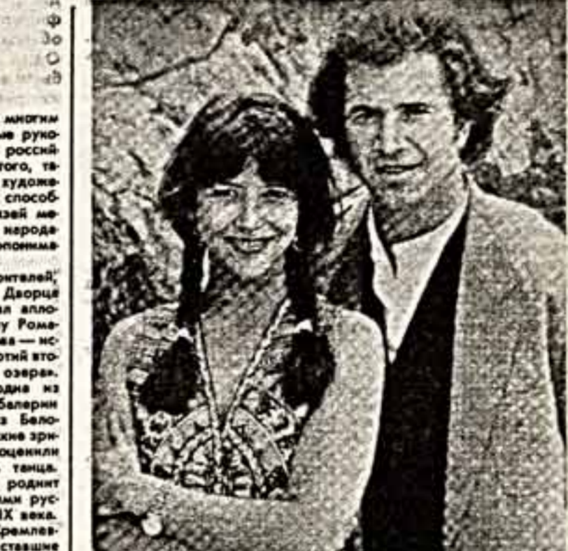
СОФИ МАРСО В ШОТЛАНДИИ

«Этих гастролей мы ждали давно и с большим нетерпением», — отметили в беседе с корреспондентом ИТАР-ТАСС представители министерства культуры КНР. — Мы знаем, что сегодня нам представляется возможность познакомиться с творчеством и мастерством самой знаменитой в мире школы балета — русской. Нынешние гастроли — российский коллектив — это, несомненно, огромный и приятный подарок не