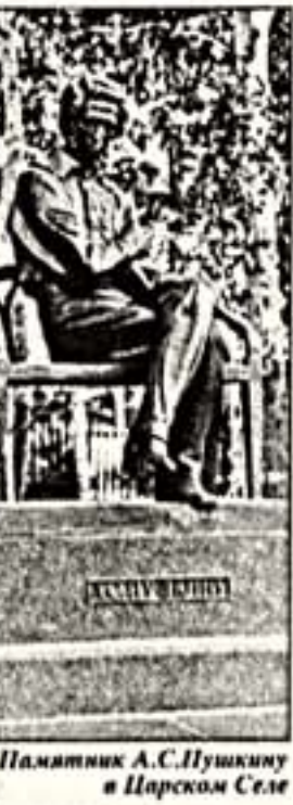
Памятник А.С.Пушкину в Царском Селе

К 100-летию памятника "Пушкин-лицеист" в Царском Селе