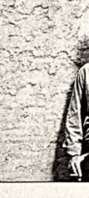
М.Казанов. "Иосиф Бродский"

женской фотографии не существует, то, несомненно, существует предмет, завуалированный в названии выставки — мужчина, каковы его видения. Предмет любви, невидимости, ревности, соперничества и неслыханного интереса. Картина получается очень красивой и очень разная. И дело не в тонкостях распределения ролей между мужской и женской — фотографии из России, Украины, Финляндии, Югославии, Словакии, Греции и США). Взгляд камеры есть агрессивный, властный взгляд, подчиняющий себе объект, — но таков и мужской взгляд. Женщина, глядящая в выдвинутого, неизбежно берет на себя "мужскую" роль, отводя своей модели традиционно "женское" место. Поэтому в экспозиции так много фотографий, где мужчины ведут себя как девушки-модели: уверенно позировот, кокетничают (как в серии "Beach Boys" Мариины Олескиной), демонстрируют себя