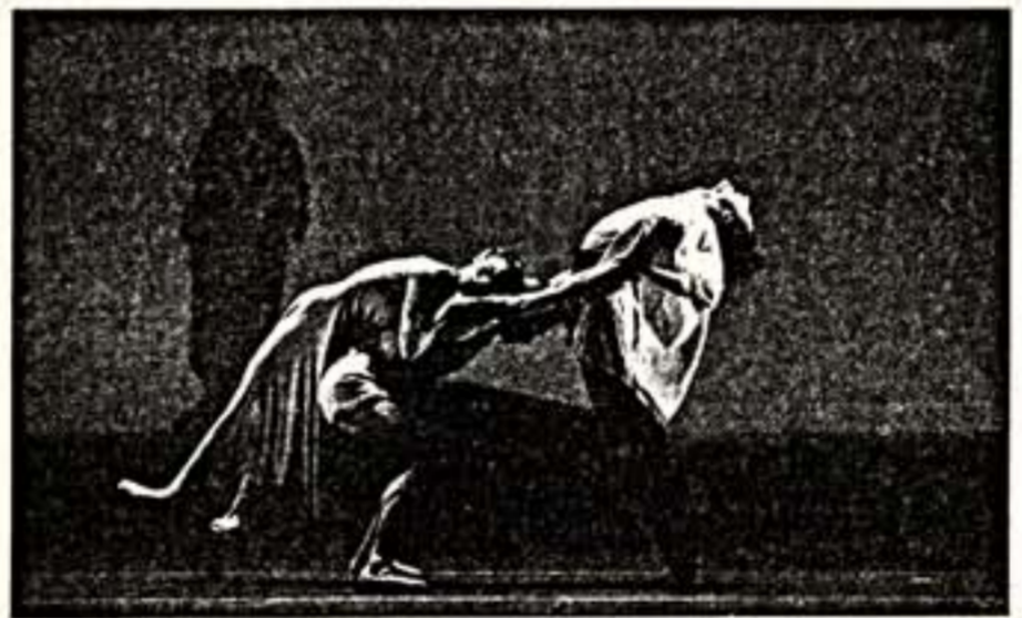
Сцены из спектаклей "Послеполуденный отдых фавна", "Аполлон Мусейт", "Движущиеся цели"

Балеты легендарных "Русских сезонов". Новые версии