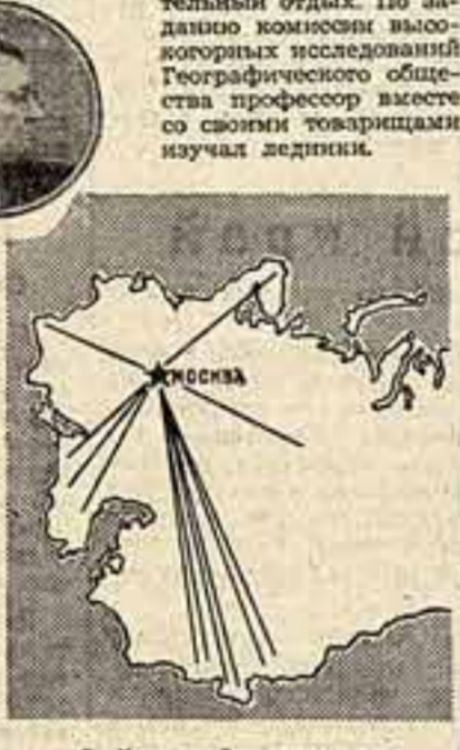
В. Немышко и схема его туристских маршрутов.

тельный отдых. По заданию комиссии высокогорных исследований Географического общества профессор вместе со своими товарищами изучал ледники.