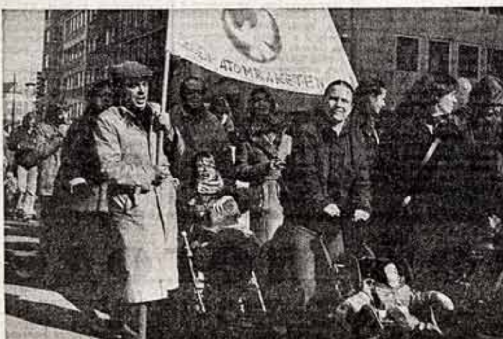
Перед лицом распухшей военной угрозы, усугубляемой опасными пламями США и НАТО разрастающейся на территории Западной Европы новые американские ядерные ракеты.

Одной из крупнейших работ молодого творческого коллектива явилась постановка пьесы