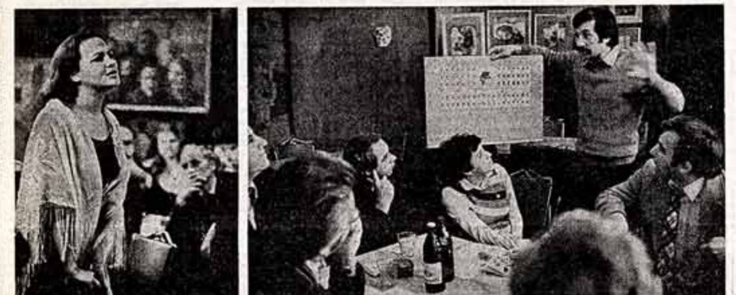
Львовский городской клуб творческой молодежи создан по инициативе городского комитета партии, обласографов и горкома комсомола в ответ на постановление ЦК КПСС «О работе с творческой молодежью». Клуб стал своеобразным культурным центром, который объединяет свыше трехсот молодых художников, авторов, журналистов, писателей, артистов. За неделю его существования проведено свыше 60 разнообразных по форме и тематике мероприятий, на которых побывали почти 70 тысяч человек, так как двери клуба открыты для всех желающих.