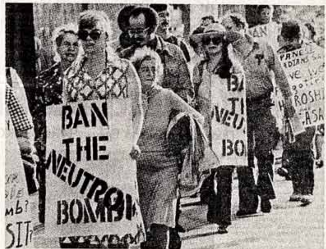
В Канаде проводится широкая кампания протеста против намерения США начать производство нейтронной бомбы.

На проходящей в Женеве сессии Комитета ООН по правам человека был официально представлен доклад Советского Союза о принятых в нашей стране мерах по претворению в жизнь положений международного пакта о гражданских и политических правах.