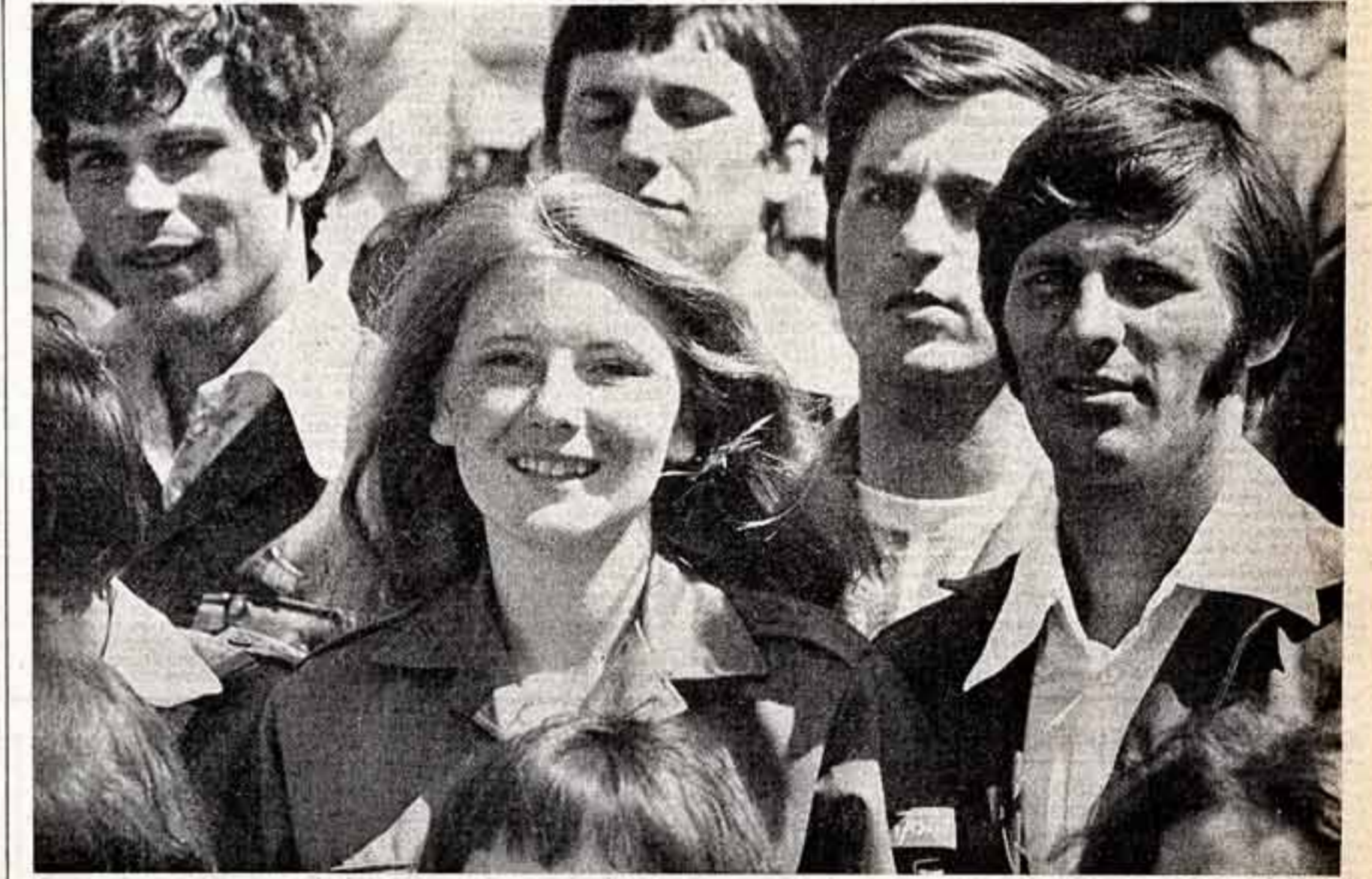
● Мы, молодая гвардия...

Осен в Грузии, по традиции, не только праздник виноградно-го сбора — ртеви, но, только время поделания много-трудных иголок работы колхоз-ников за год, но только пир-кашек и пылающих баграчек листьев виноградинок, лесов, парков, но и торжественное шествие стая.